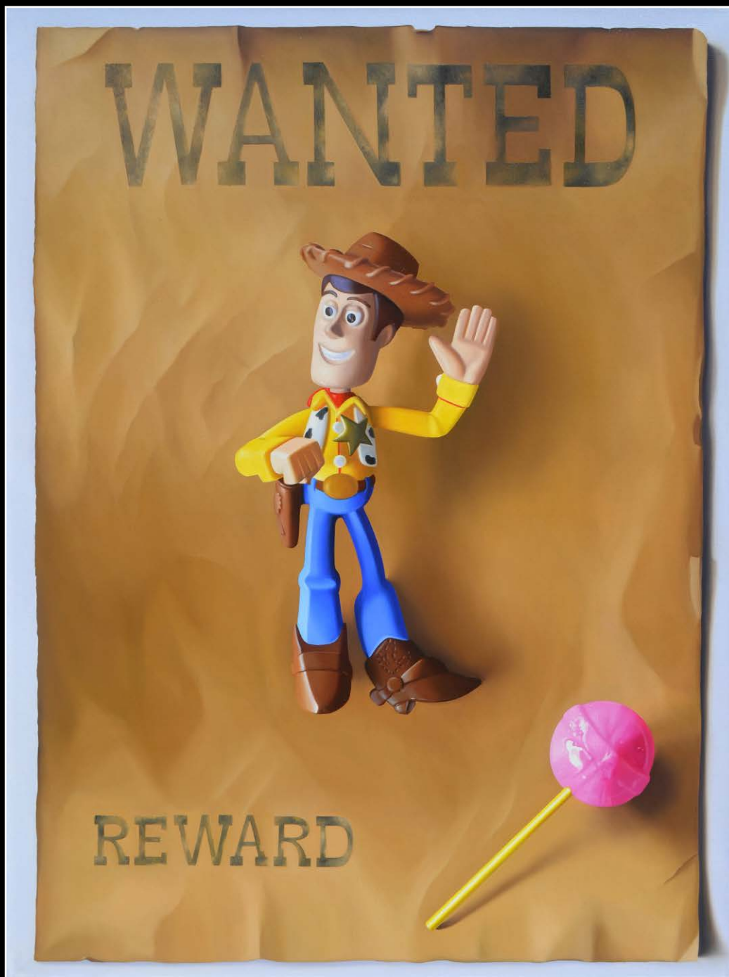
7. En busca de la ley . óleo sobre lienzo . 80x60 cm . 2020