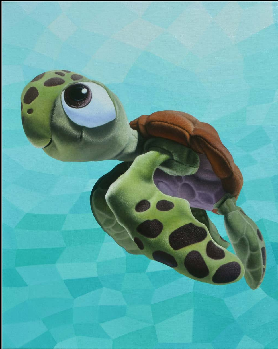
12. Sobreviviente . óleo sobre lienzo . 50x40 cm . 2020