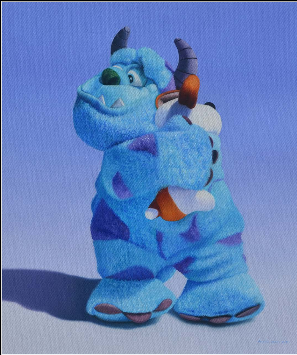
8. El mejor amigo del monstruo . óleo sobre lienzo . 43x37 cm . 2020