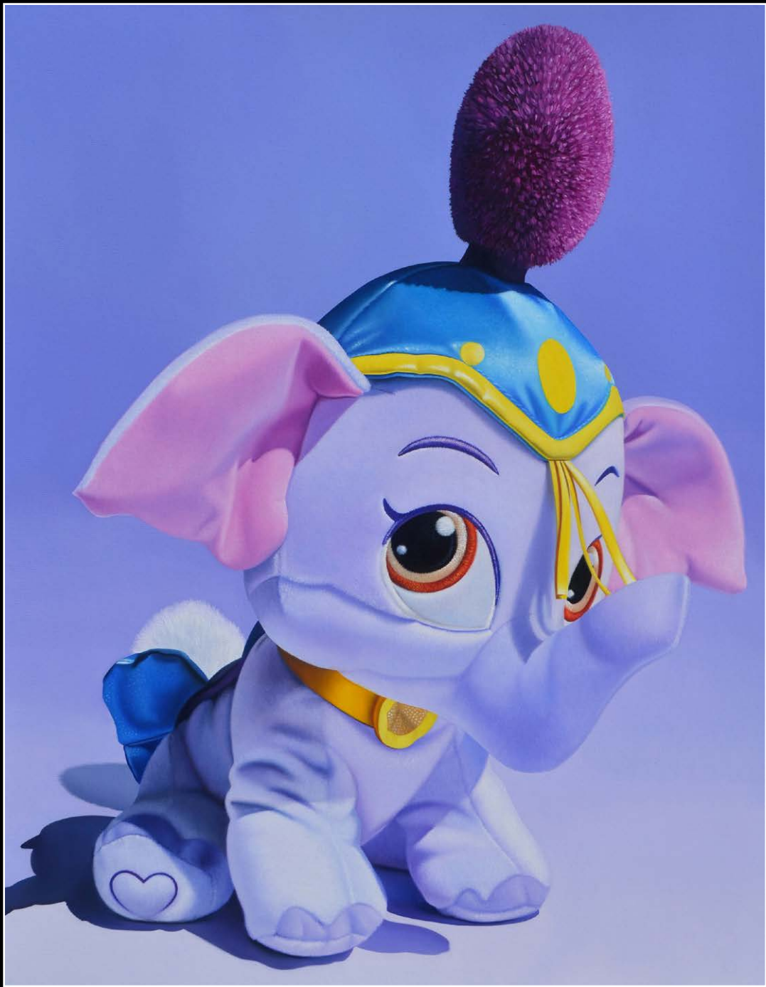
1. Engalanado . óleo sobre lienzo . 100x80 cm . 2020