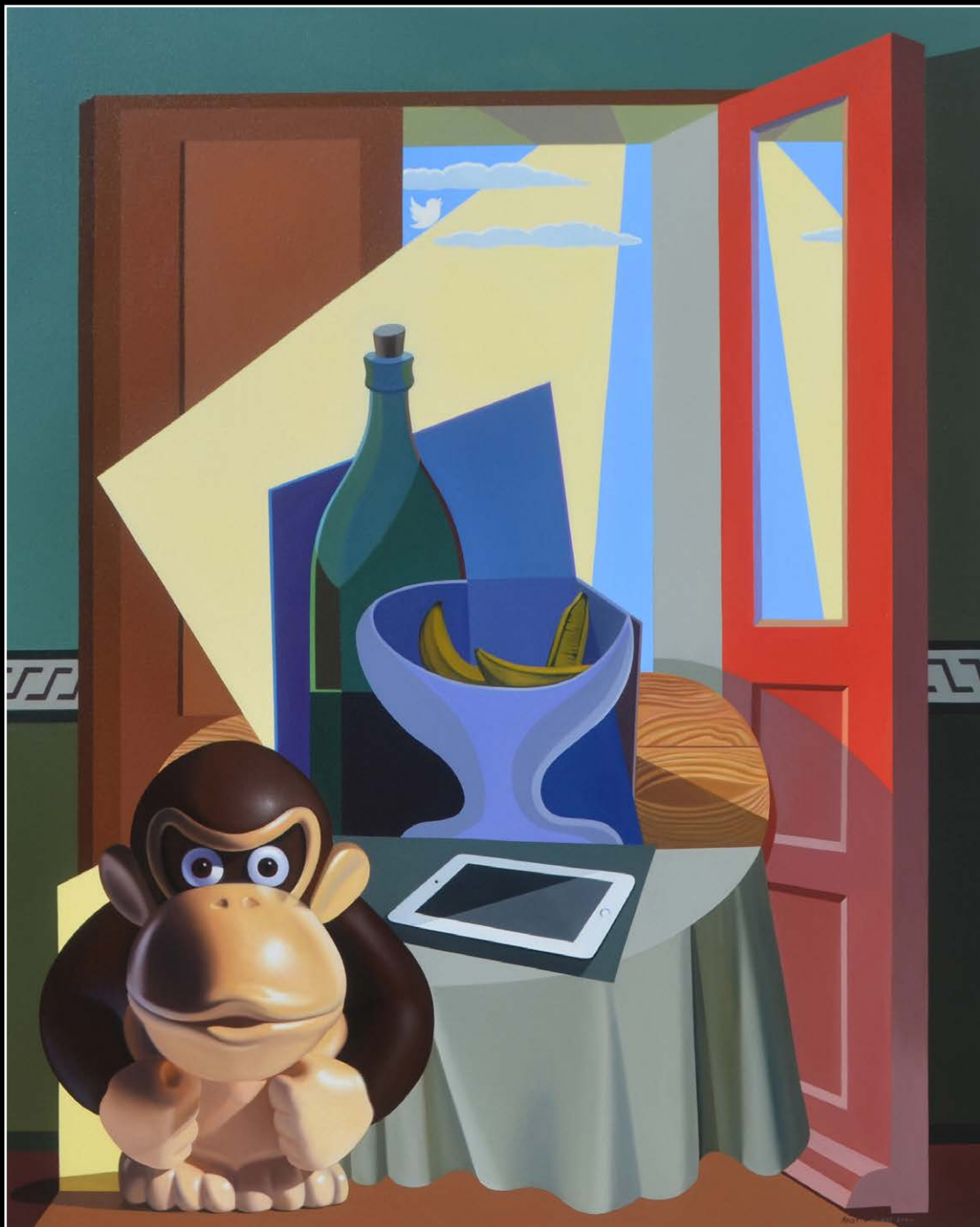
9. Hater . óleo sobre lienzo . 100x80 cm . 2020