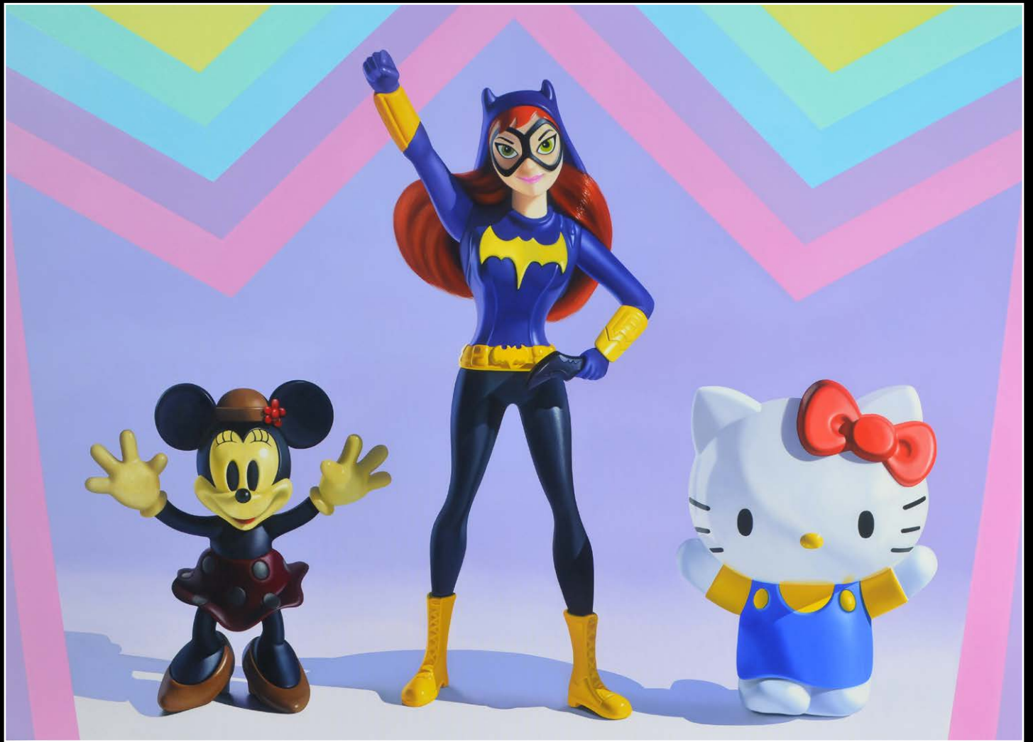
3. Girl power . óleo sobre lienzo . 130x180 cm . 2020