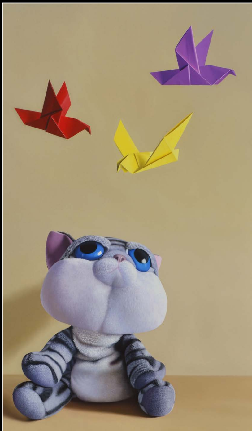
11. Más vale pájaro en mano . óleo sobre lienzo . 100x60 cm . 2020