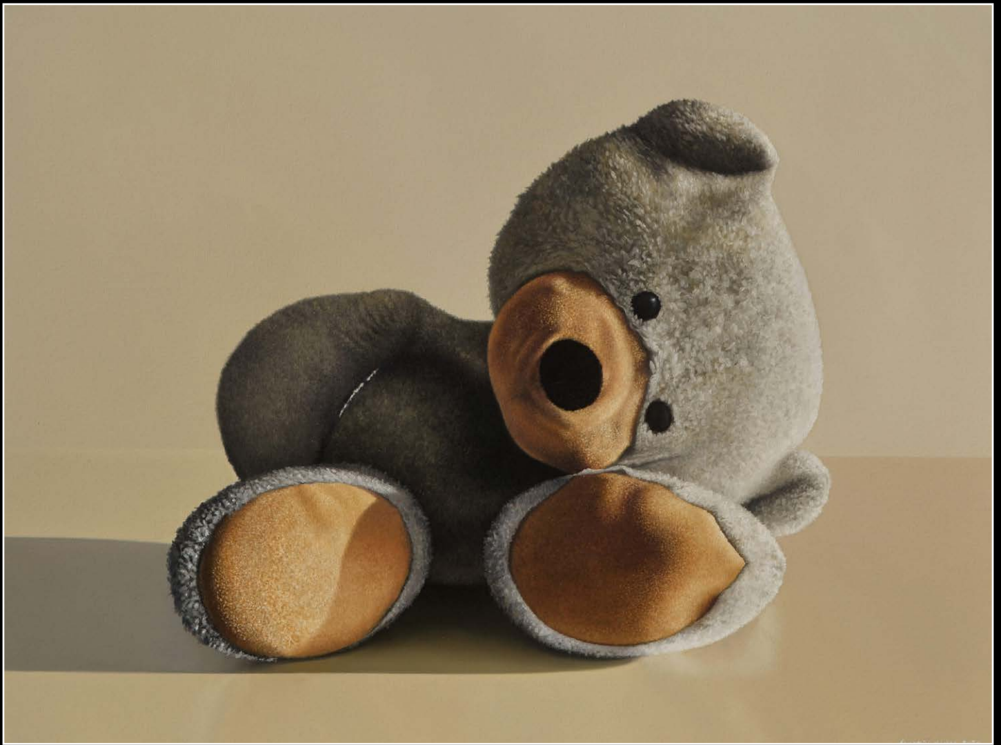
4. No me olvides . óleo sobre lienzo . 60x80 cm . 2020