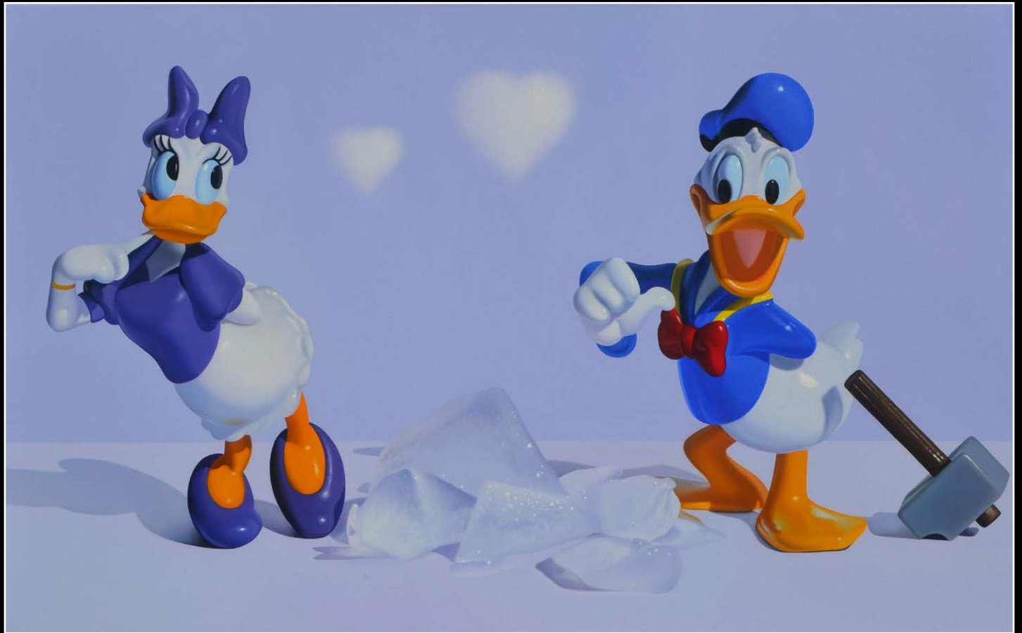
15. Rompiendo el hielo . óleo sobre lienzo . 50x80 cm . 2021