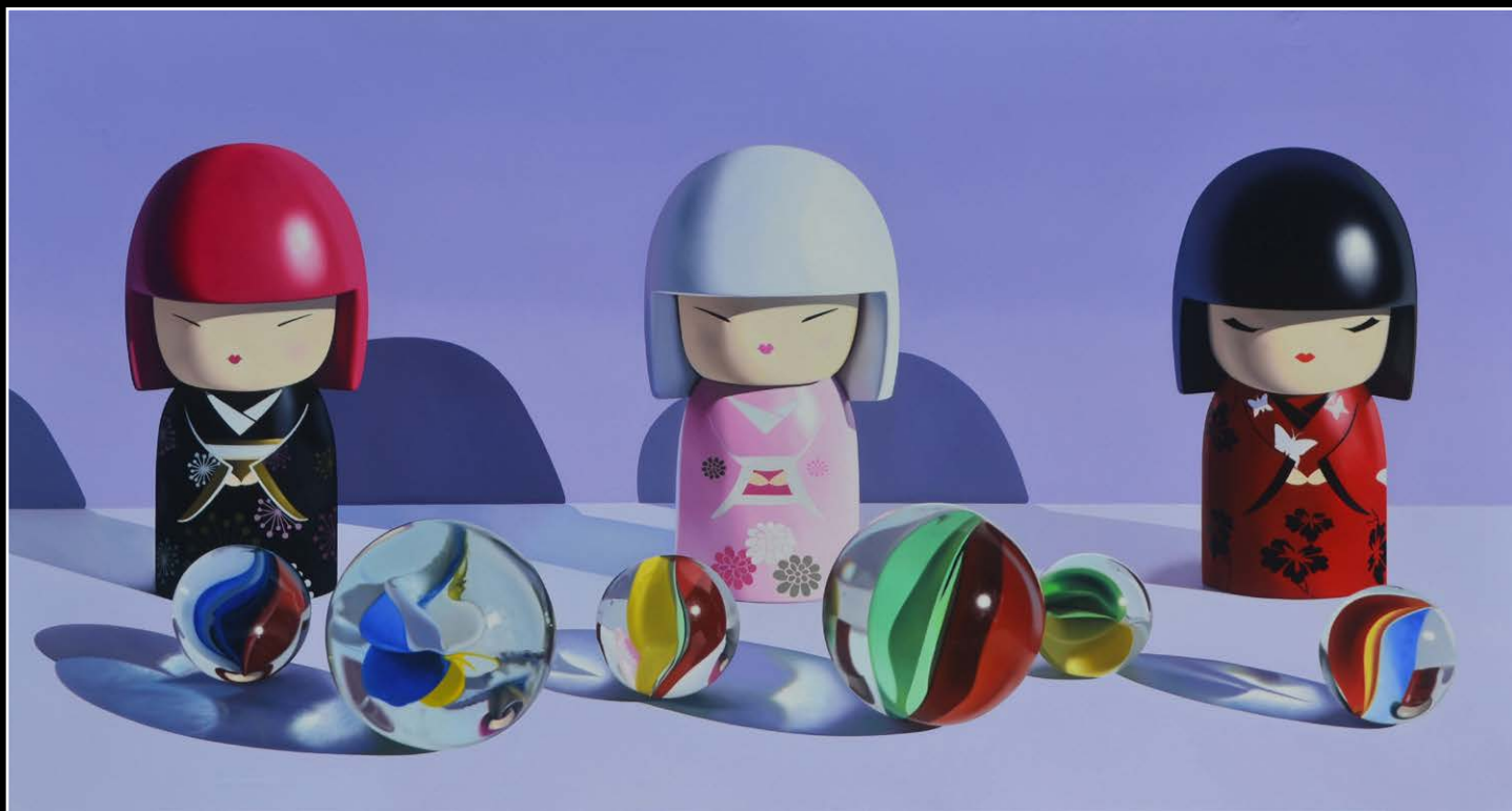
10. Japonesas . óleo sobre lienzo . 80x150 cm . 2020