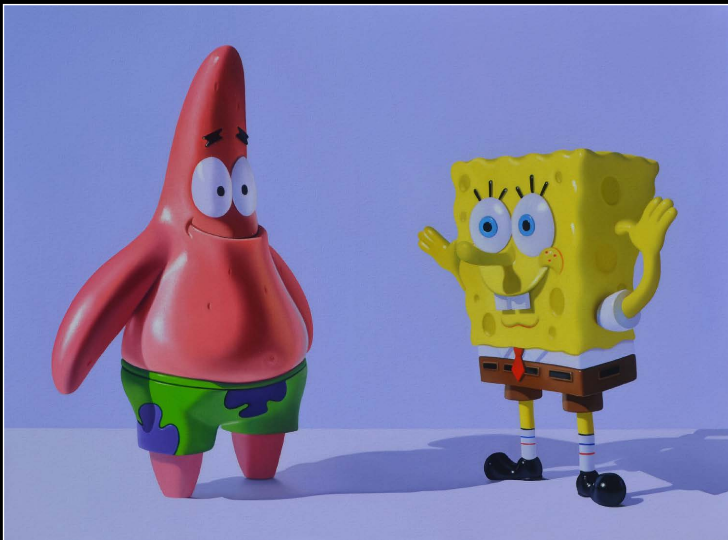
14. Reencuentro . óleo sobre lienzo . 60x80 cm . 2021