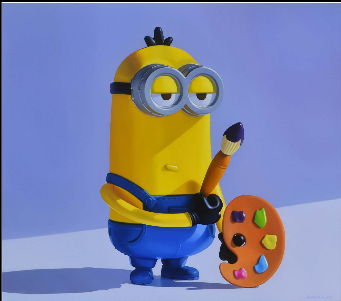
6. Ni una idea . óleo sobre lienzo . 80x90 cm . 2020