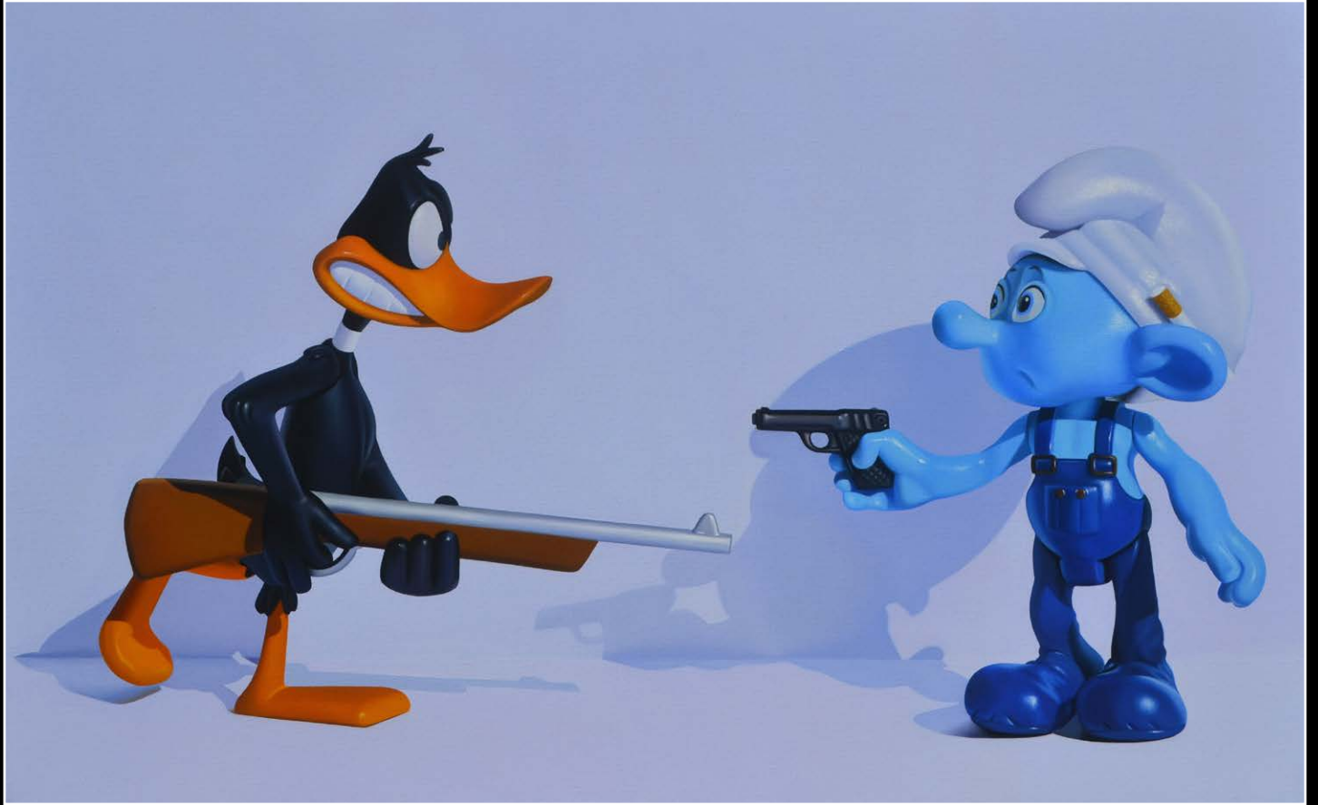
13. Tiempos violentos . óleo sobre lienzo . 50x80 cm . 2020