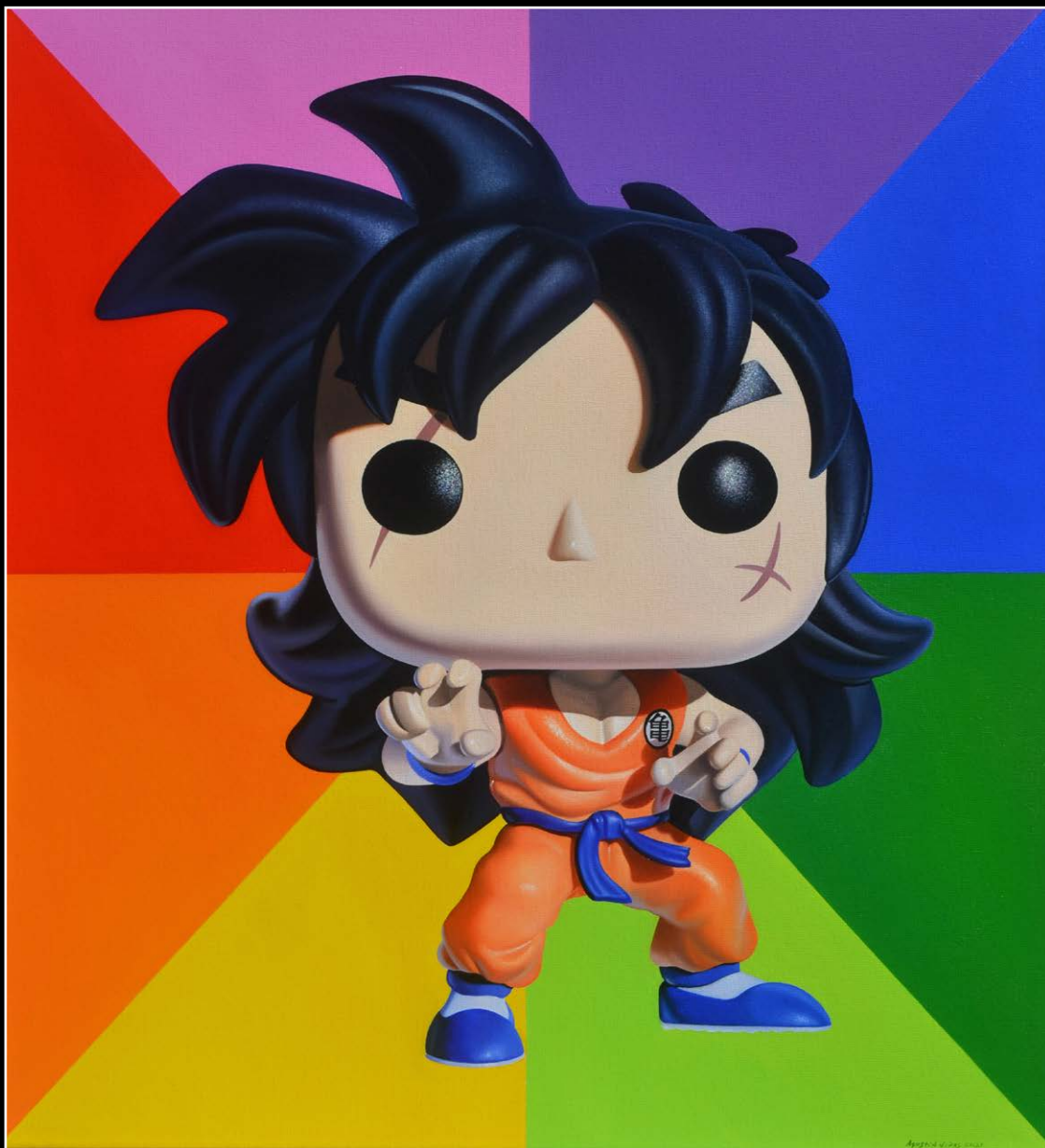
16. Dando pelea . óleo sobre lienzo . 70x60 cm . 2021