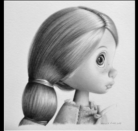
18. Tres miradas . grafito sobre papel . 20x20 cm (cada pieza) . 2018/19 . tríptico .