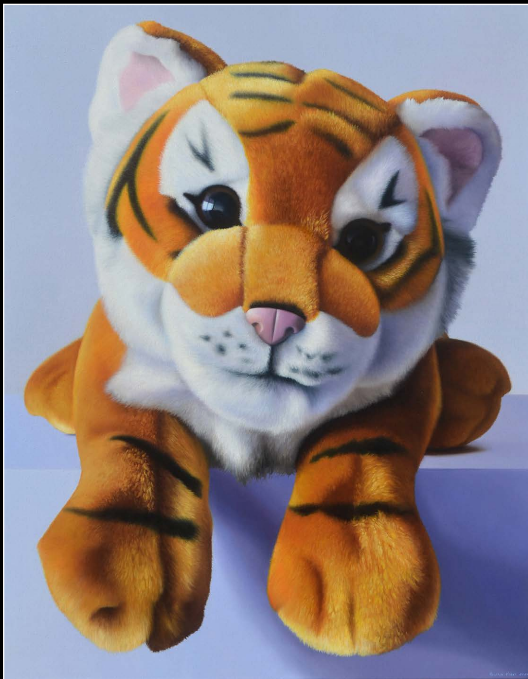
2. Animal print . óleo sobre lienzo . 100x80 cm . 2020