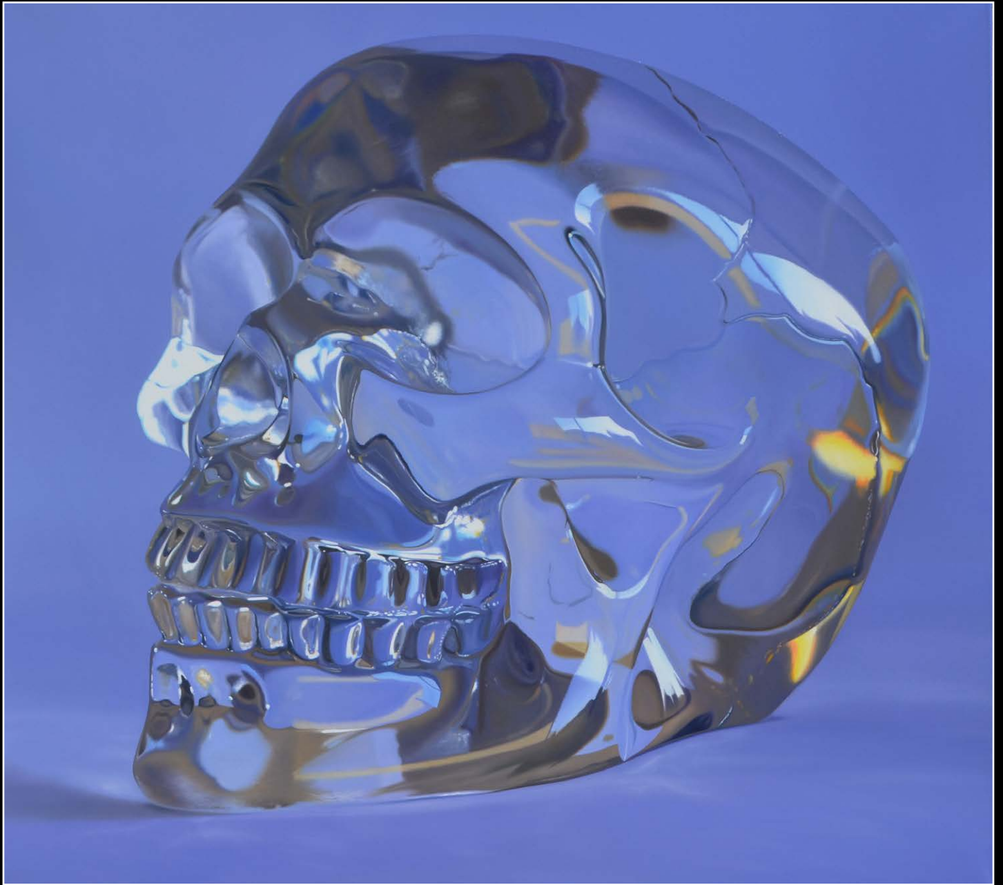
5. Game over . óleo sobre lienzo . 100x110 cm . 2020