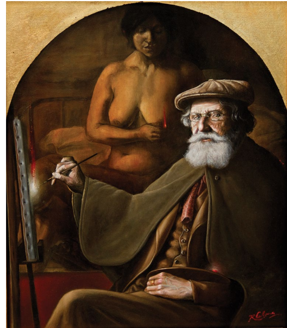
13. Homenaje a Sívori