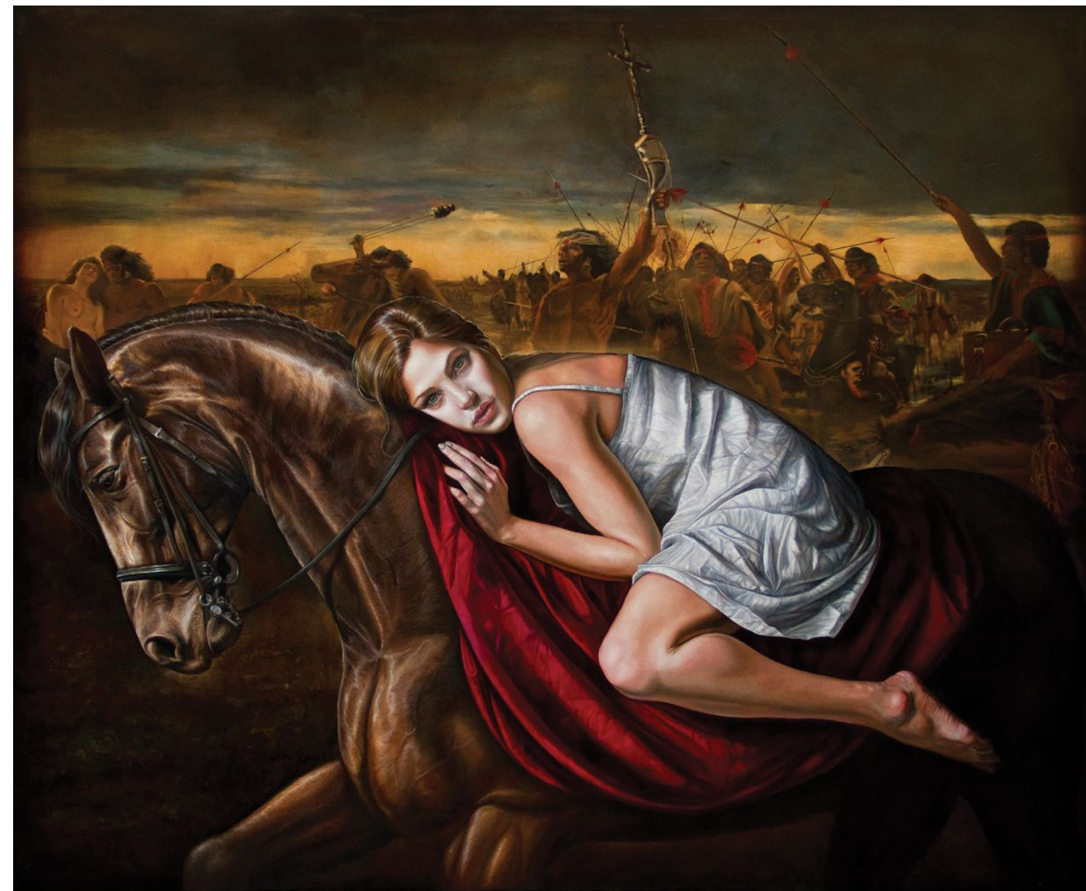
2. Cautiva Pampeana