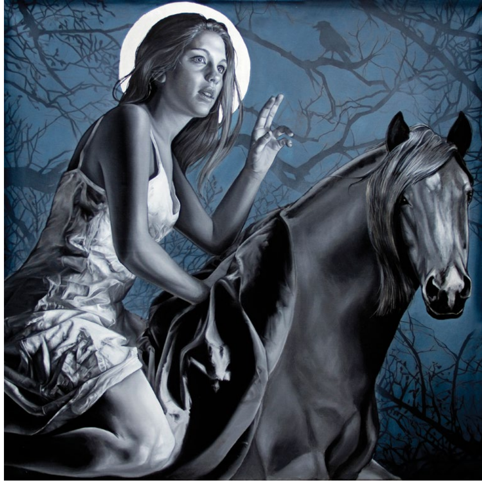
3. Cautiva Lunar