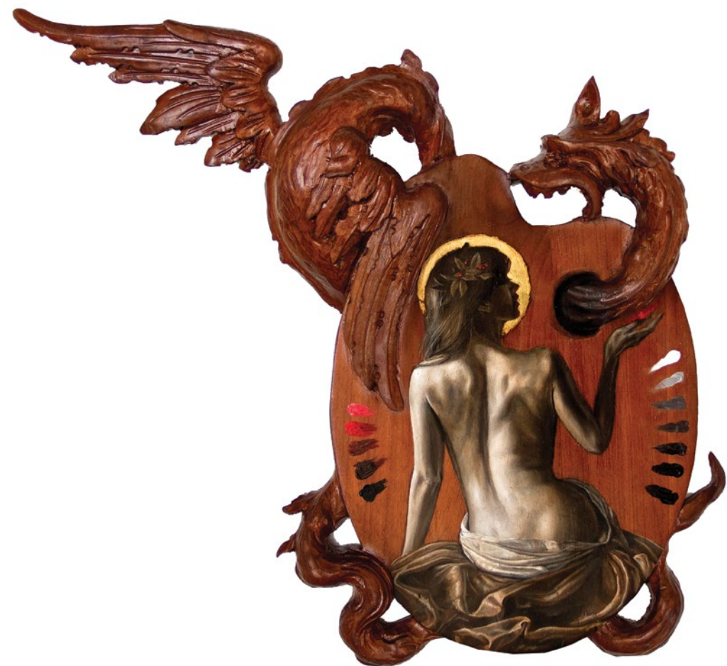
18. Paleta de Oriente