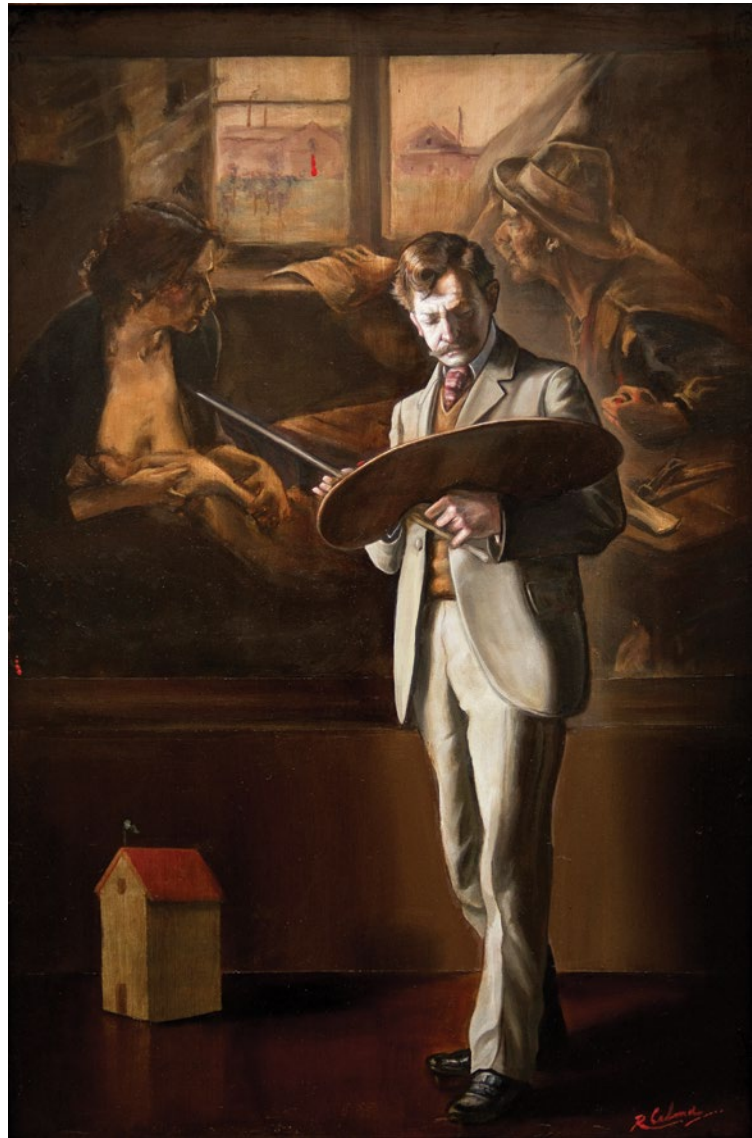
12. Homenaje a De La Cárcova