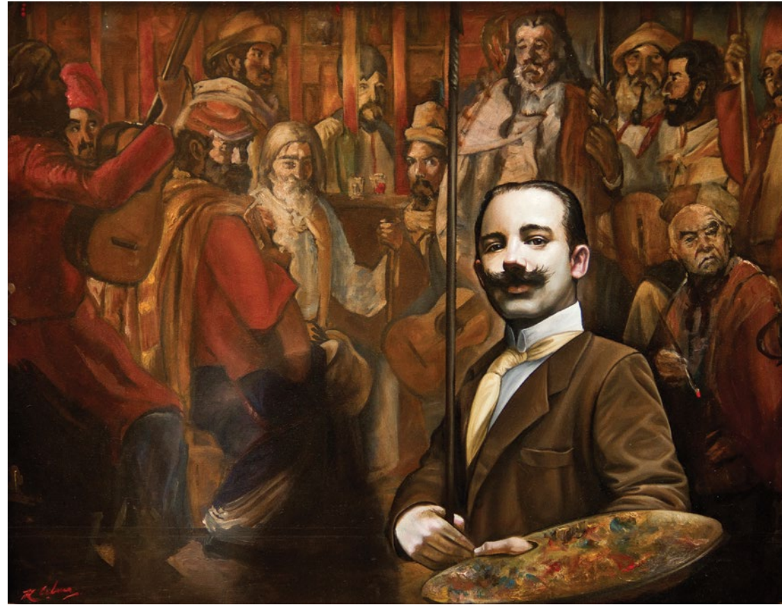
10. Homenaje a Quirós