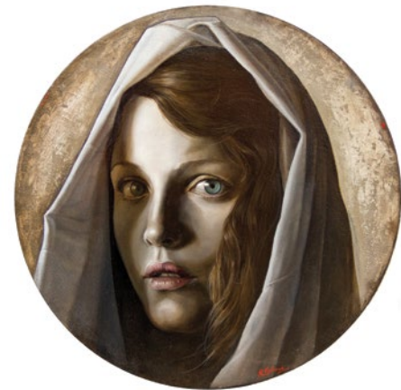
16. Las Tres Marías 3