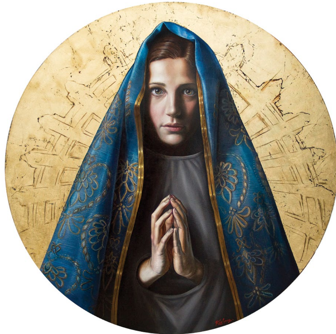
17. Las Tres Marías 1, Virgen de Luján