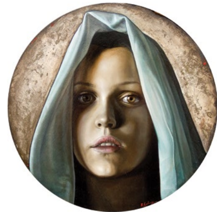
15. Las Tres Marías 2