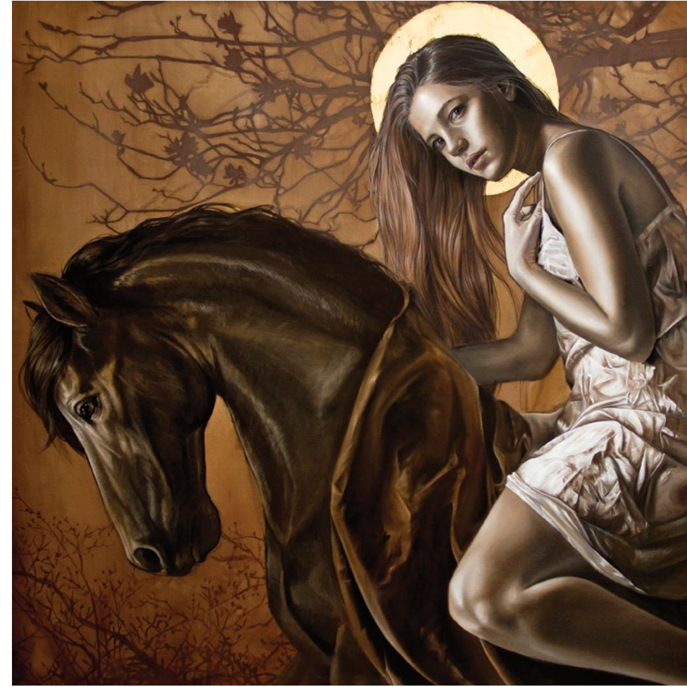
4. Cautiva Solar