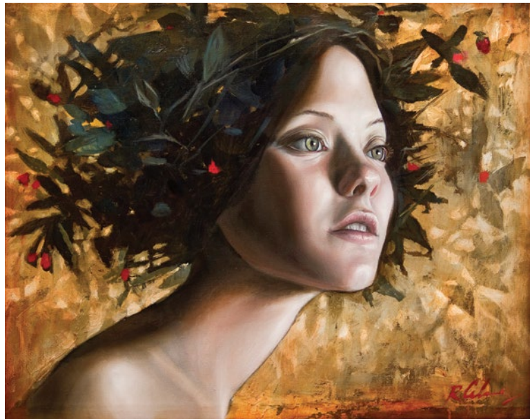
6. Mujer Floral 2