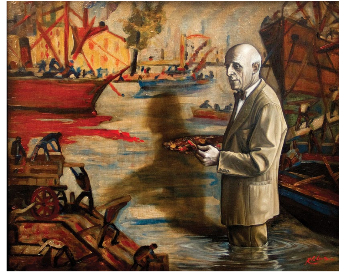
11. Homenaje a Quinquela Martín