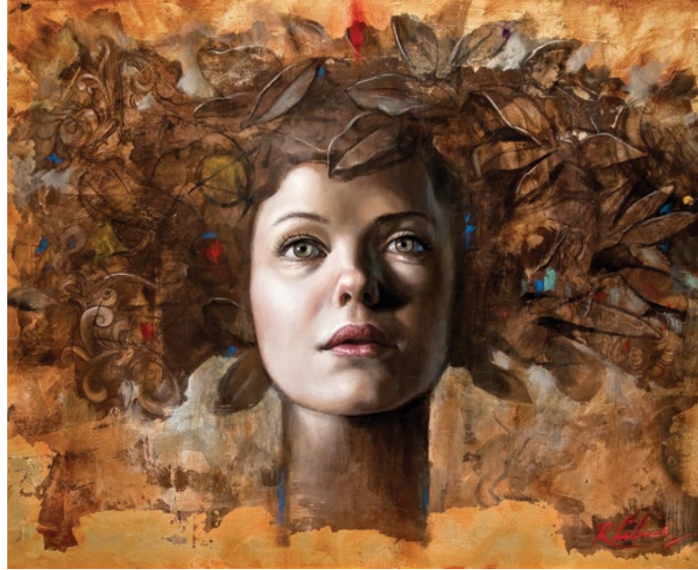
5. Mujer Floral 1