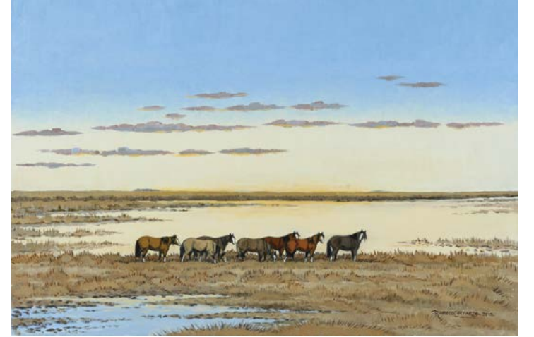
19 | Tarde Luminosa