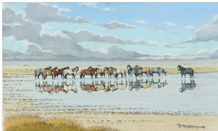
13 | Como sobre un Espejo