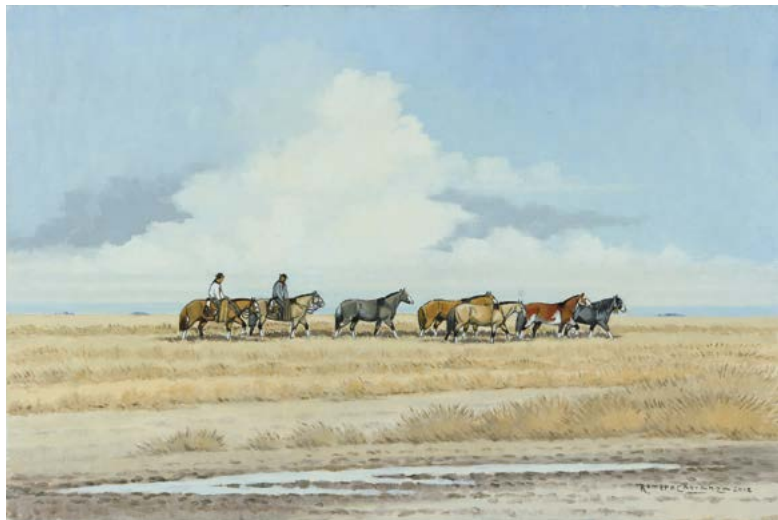
10 | Volviendo a las Casas