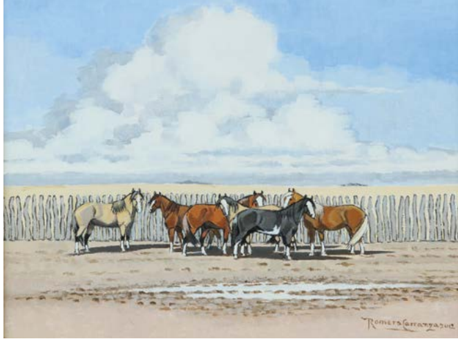
4 | Los Potros en el Corral