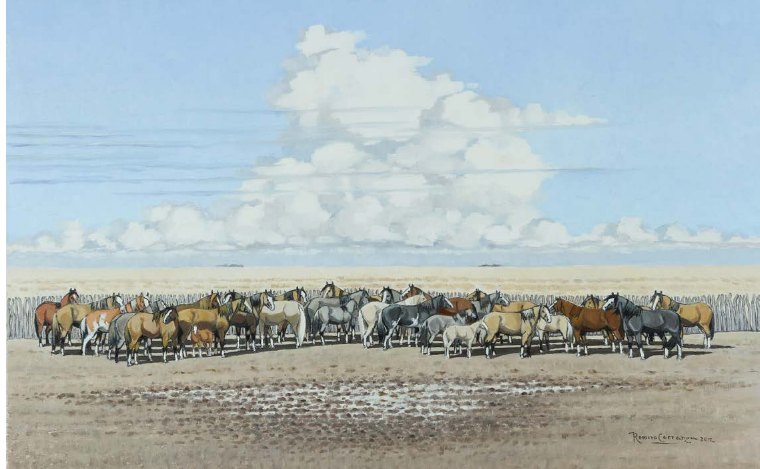
6 | La Manada en el Corral