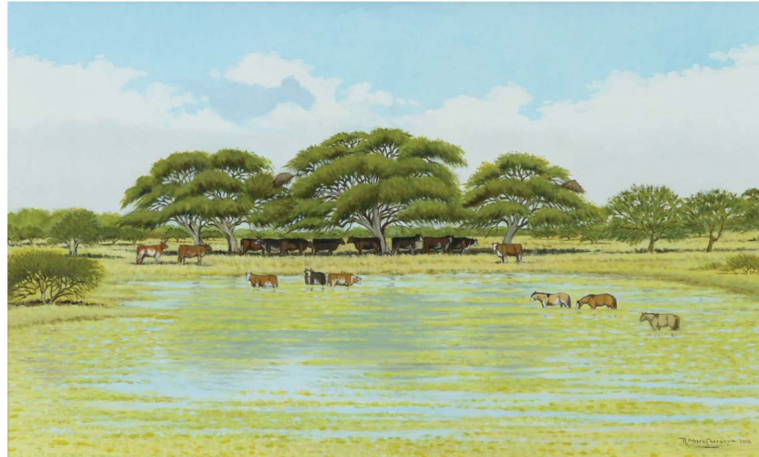
9 | El Tajamar