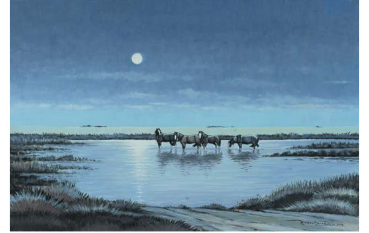
23 | Luna Llena en la Laguna