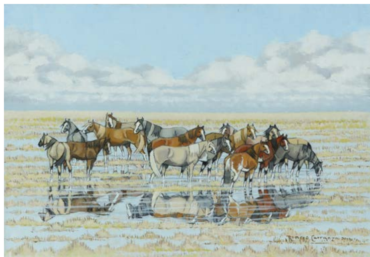
14 | Campos Inundados