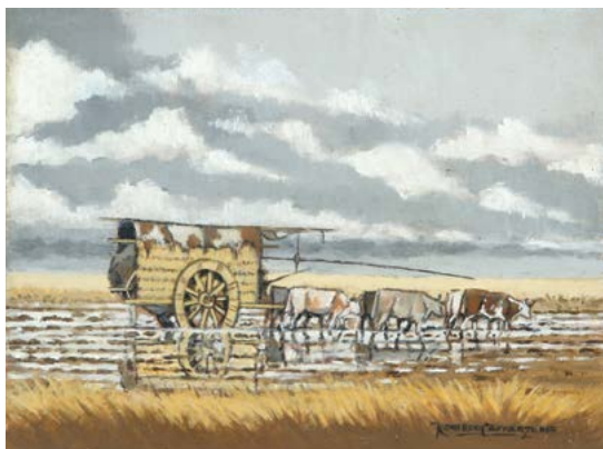
25 | Atravesando el Guadal