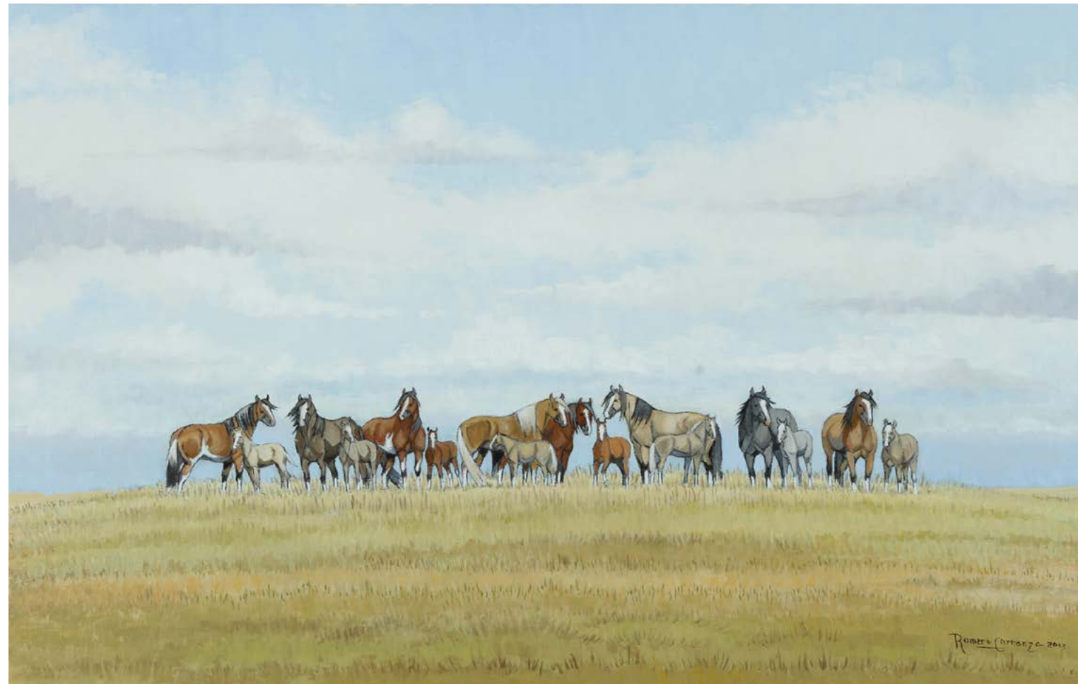
12 | En la Cresta de la Loma