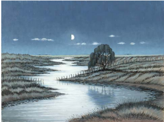
22 | Luna Menguante en el Tala