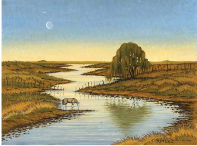
21 | Luna Nueva en el Arroyo