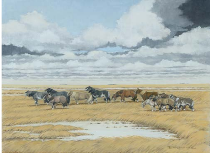
17 | Aguantando el Pampero