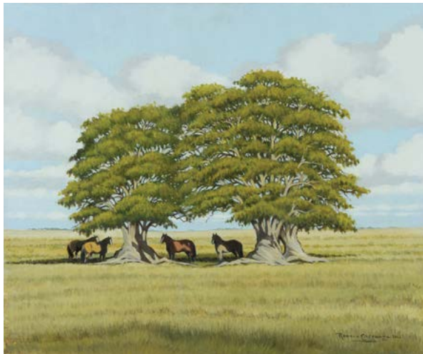
8 | Los Dos Ombúes