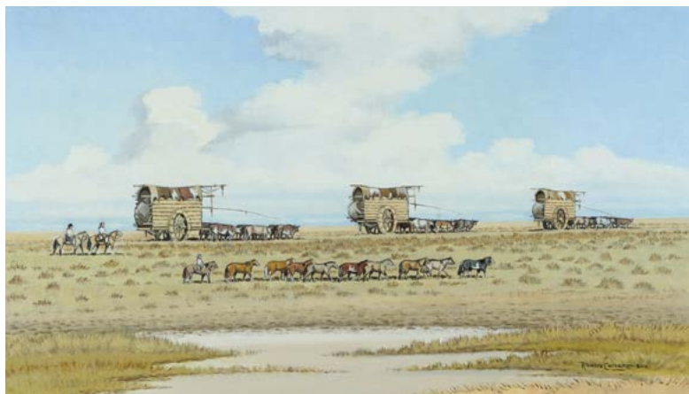
11 | Tropa de Carretas