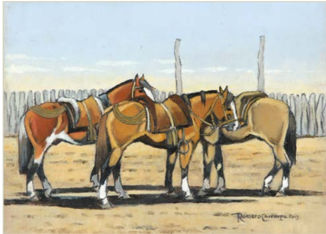
5 | Listos para la Tarea