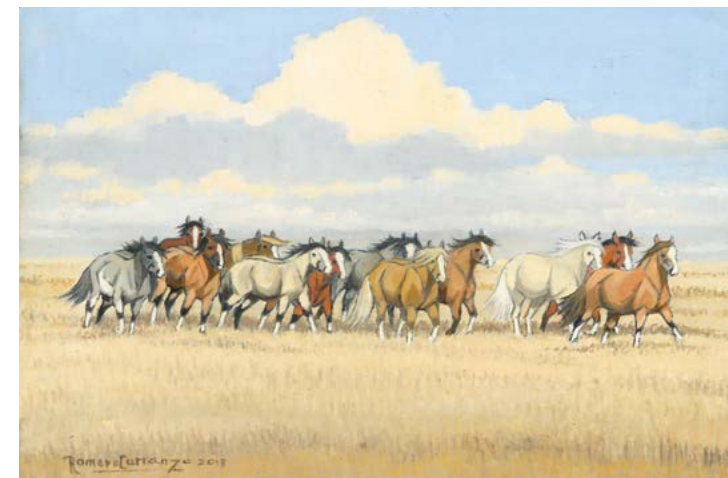
2 | Tropel en la Llanura

del martes 18 de noviembre al viernes 19 de diciembre de 2014 de lunes a viernes de 10.30 a 21 hs. y sábados de 10.30 a 13 hs.