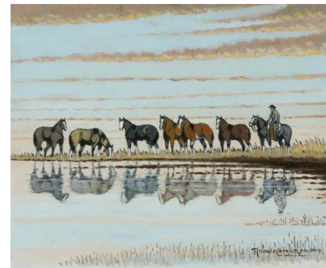
16 | Reflejos al Atardecer