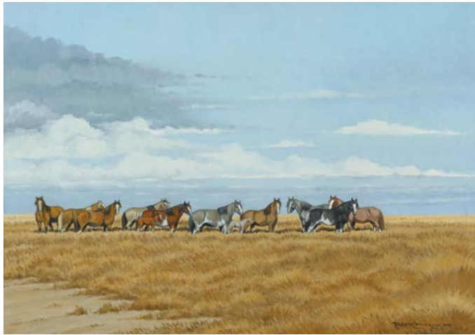
18 | Manada en el Pajonal