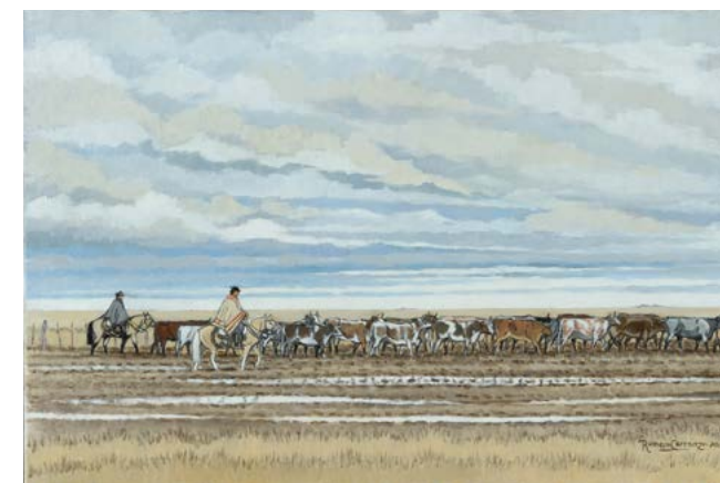
15 | Tiempo Lluvioso