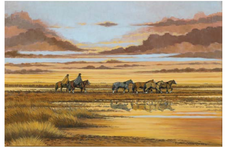
20 | De Vuelta al Pago