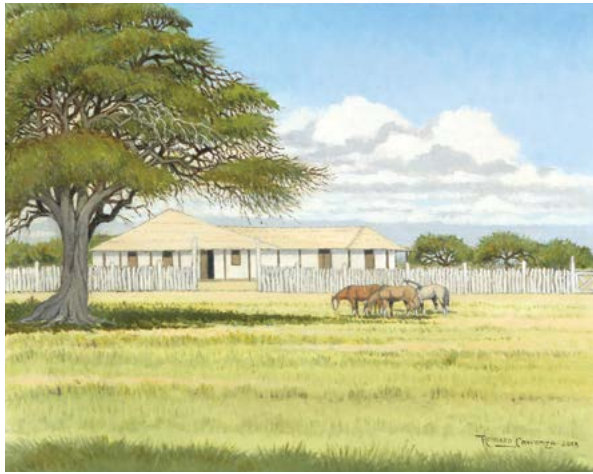
7 | Estancia Entrerriana