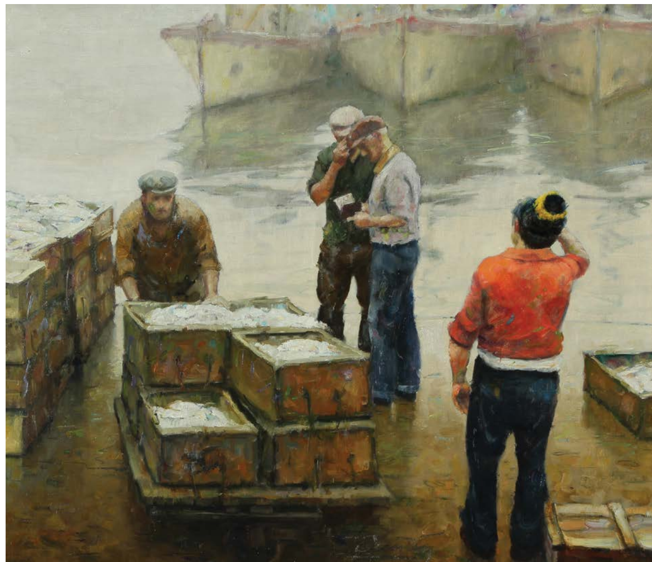
14 Banquina Marplatense