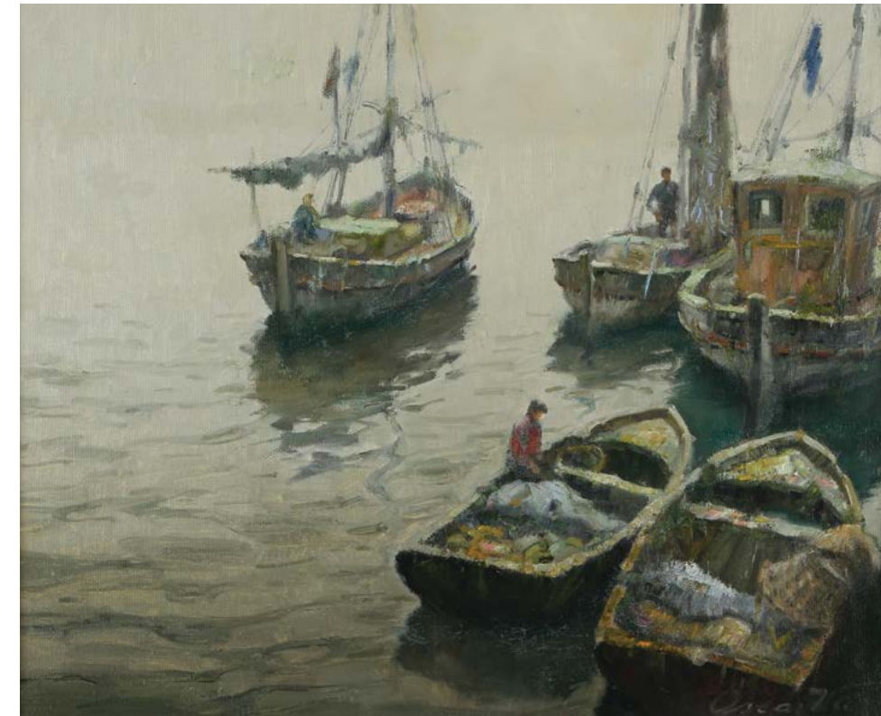
2 Rincón del Dock Sud

del lunes 8 de septiembre al sábado 4 de octubre de 2014 de lunes a viernes de 10.30 a 21 hs. y sábados de 10.30 a 13 hs.