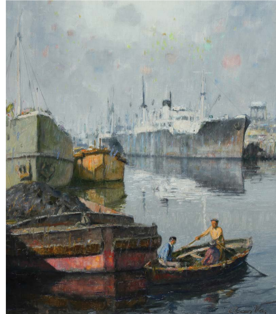
9 Puerto Carbonero