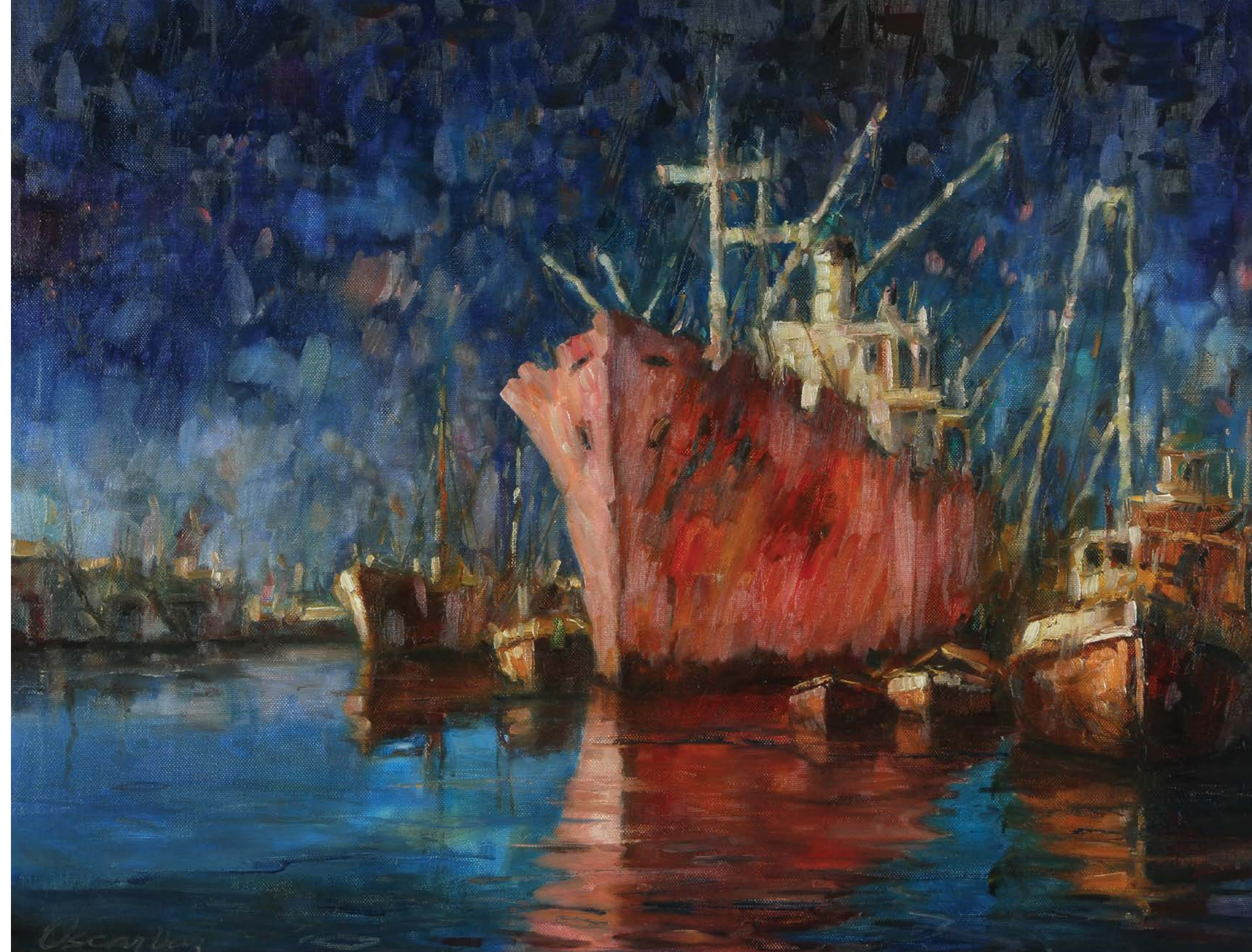
7 Escena de Puerto