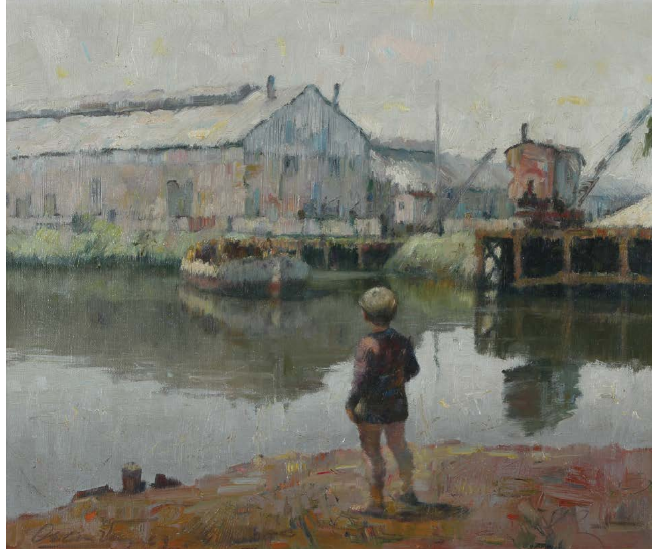
12 Paisaje del Río