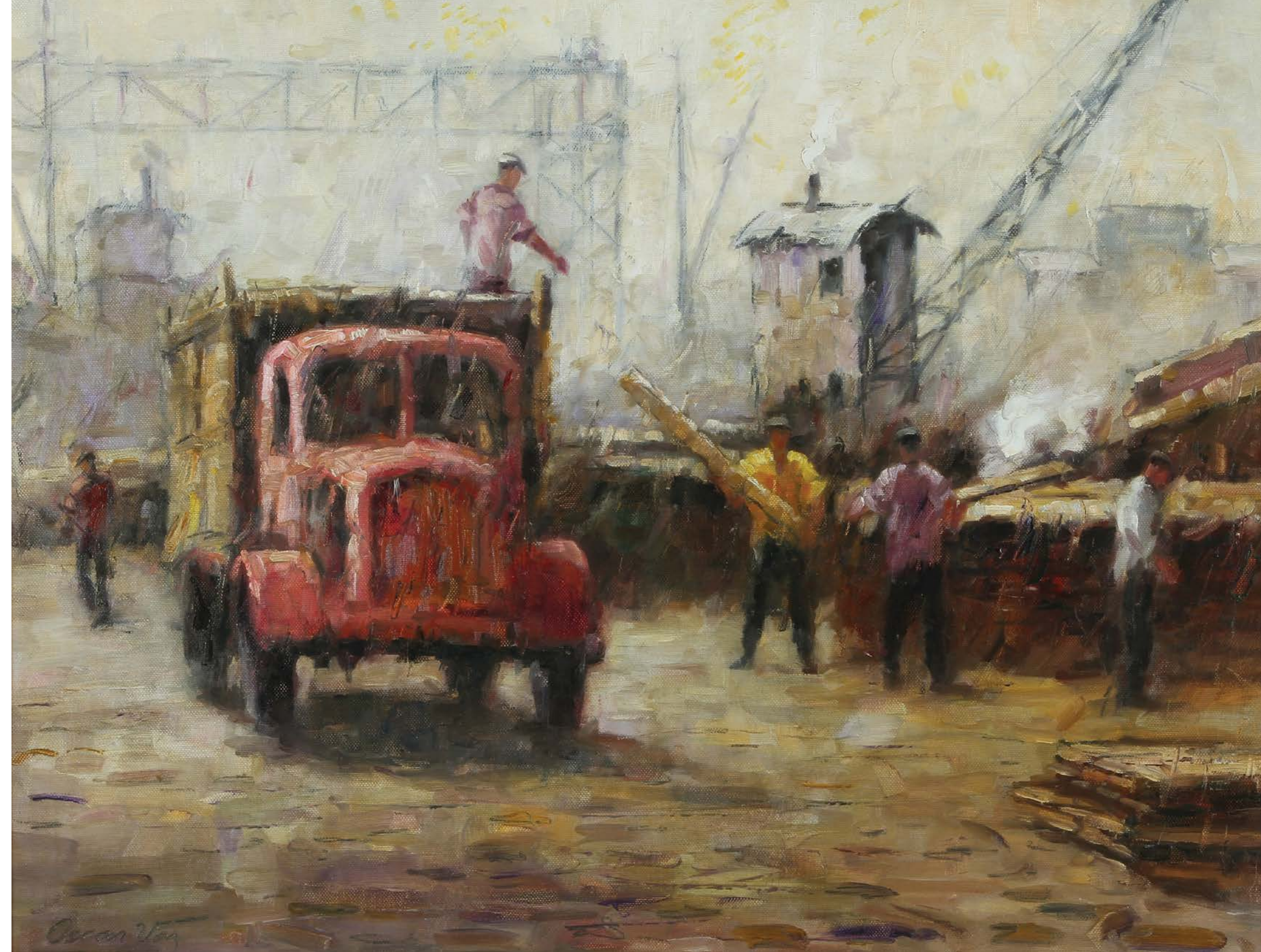
15 Cargando Madera, Riachuelo