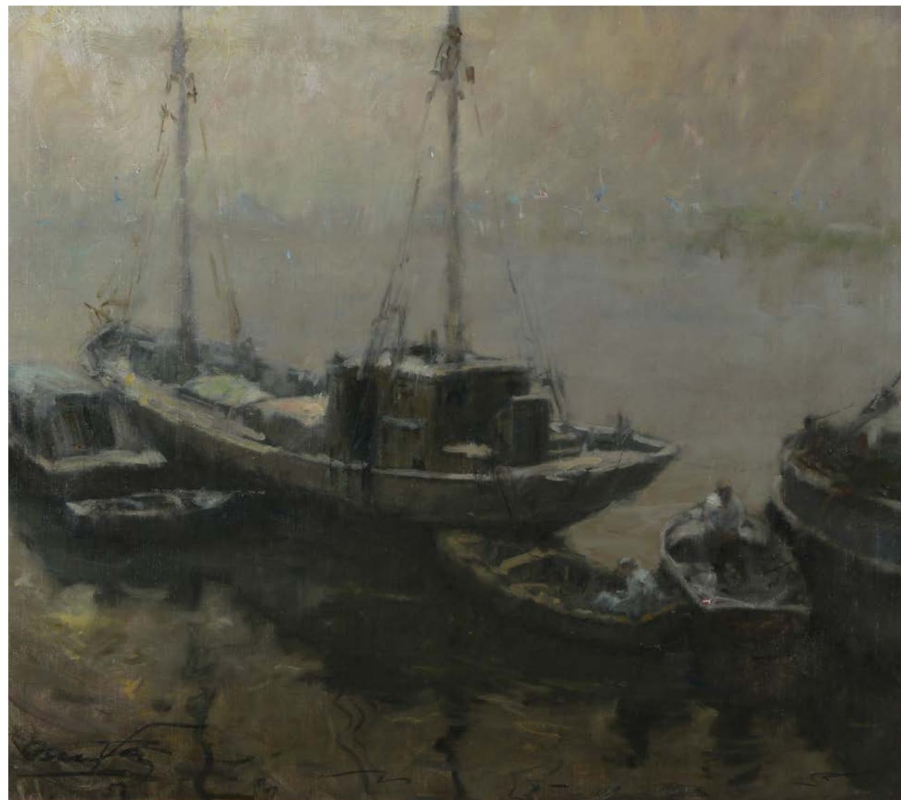
6 Niebla del Riachuelo