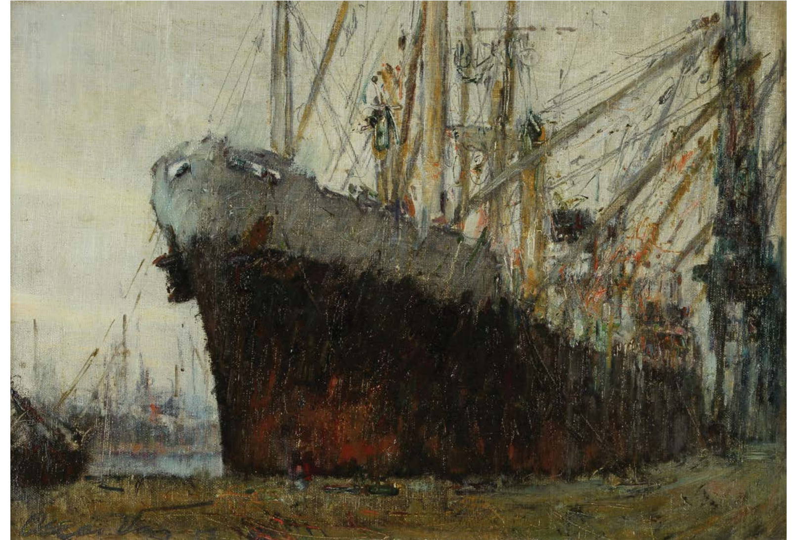
5 Carguero de Ultramar