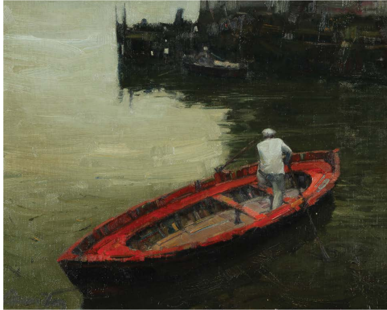
8 El Botero