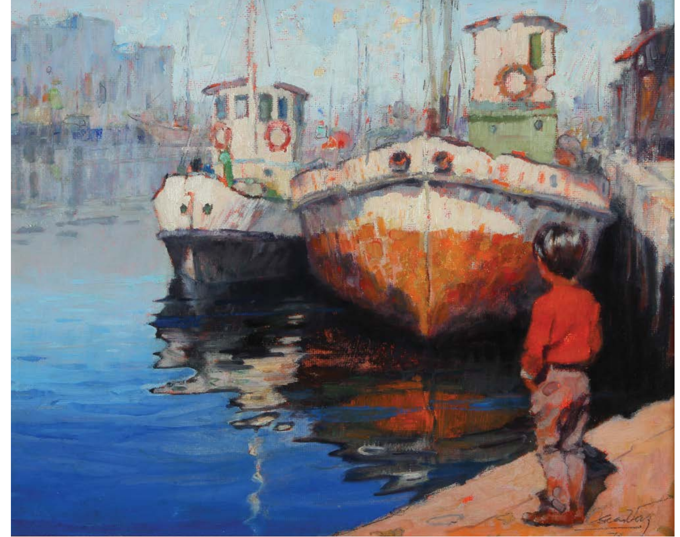
13 Ribera Azul