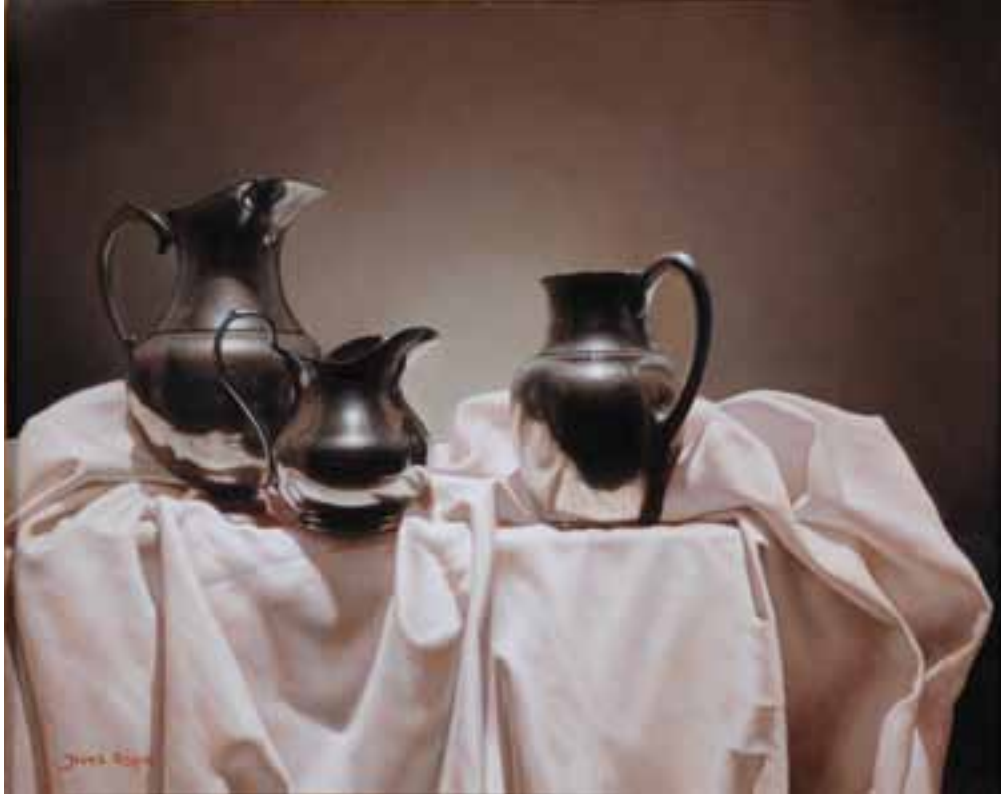
9. Jarras Flamencas