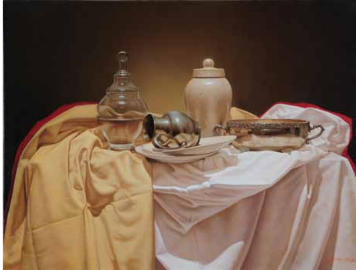
10. Recuerdos de Bélgica