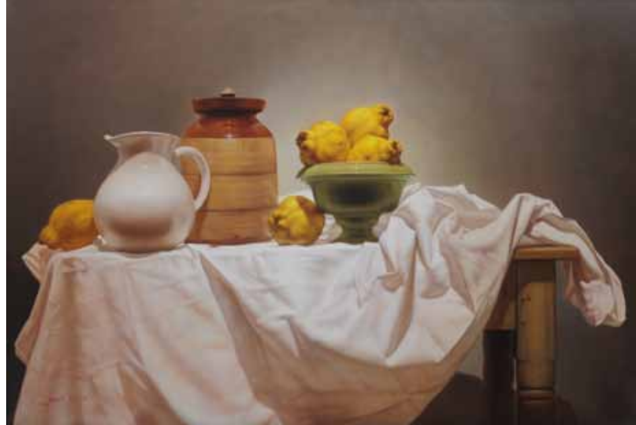
12. Membrillos y Jarras