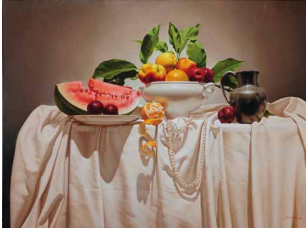
4. Homenaje a Heem