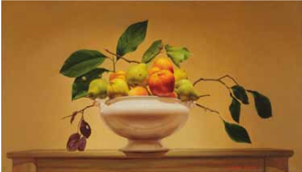
3. Homenaje a Caravaggio