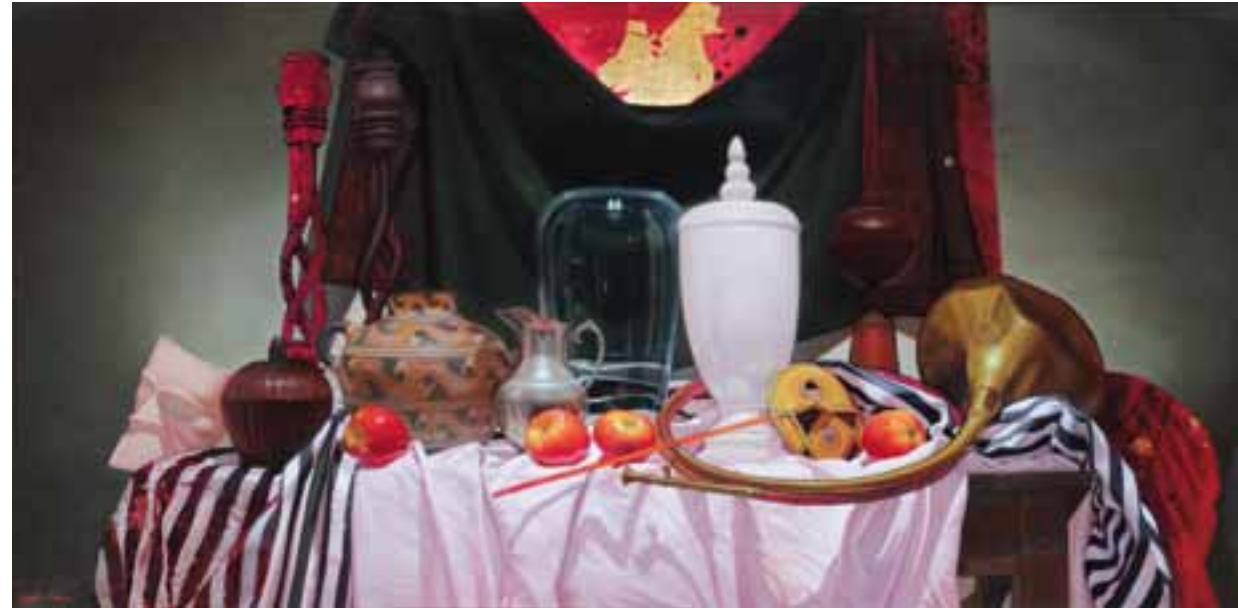
6. Homenaje a la Música