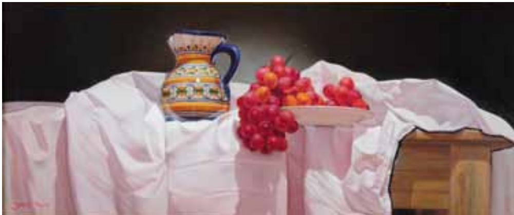
5. Homenaje a Mendoza