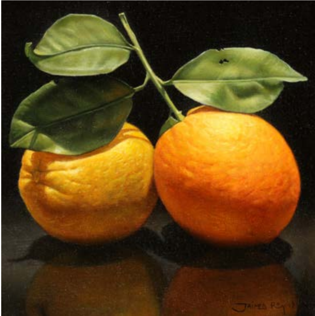
61 Naranja con Rama . óleo sobre lienzo . 20 x 20 cm . 2019