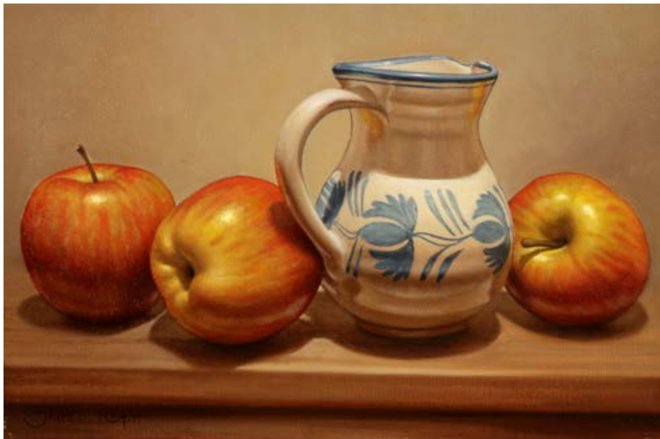
9| Jarra Aragonesa . óleo sobre lienzo . 20 x 30 cm . 2019