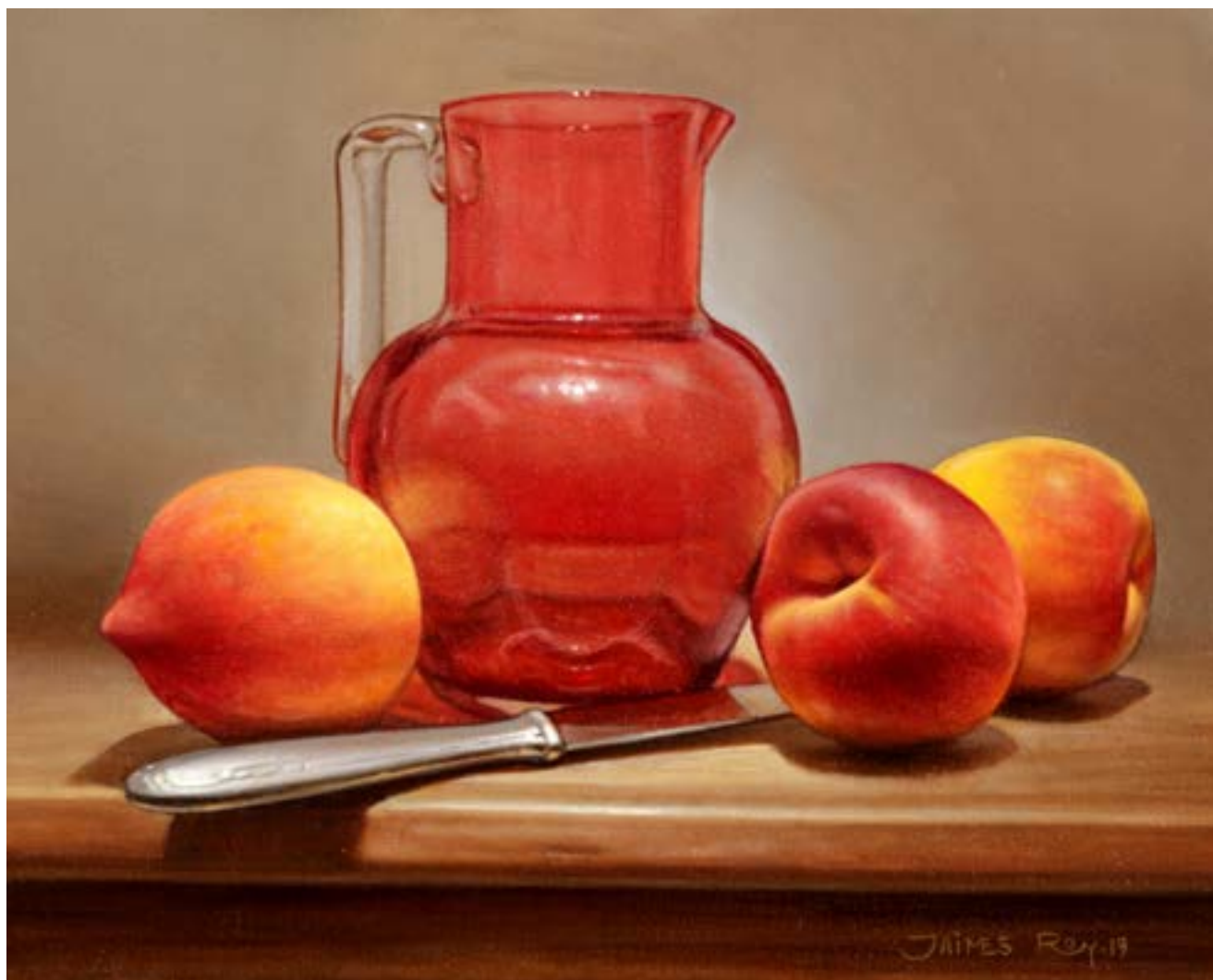
12| Cristal Carmesí . óleo sobre lienzo . 24 x 30 cm . 2019