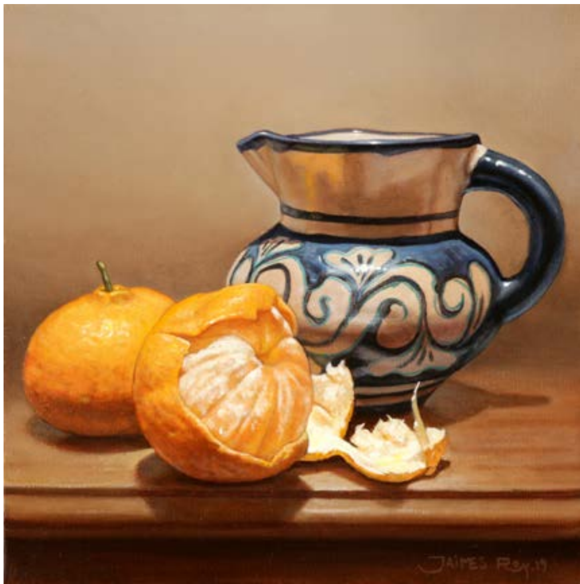
14| Mandarinas . óleo sobre lienzo . 25 x 25 cm . 2019