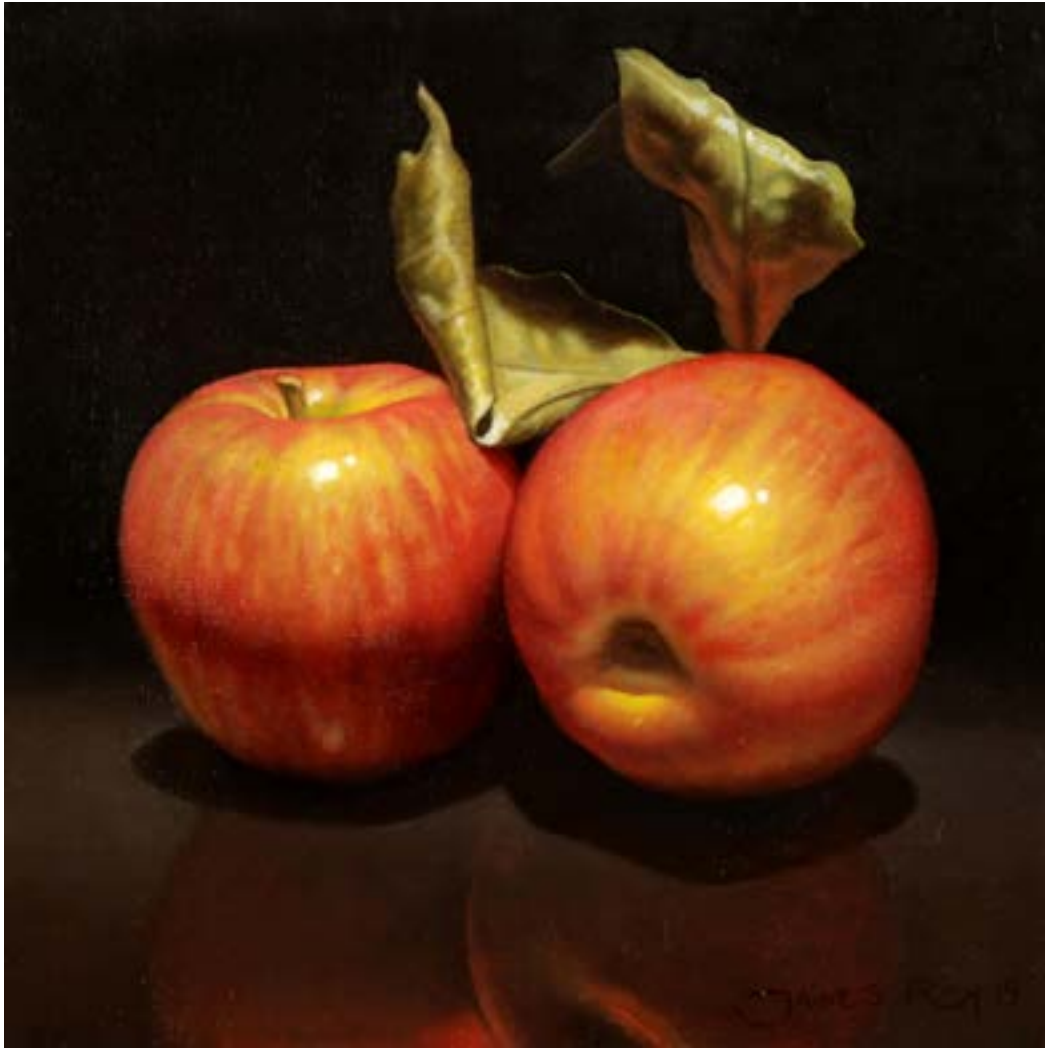
51 Hojas Secas . óleo sobre lienzo . 20 x 20 cm . 2019