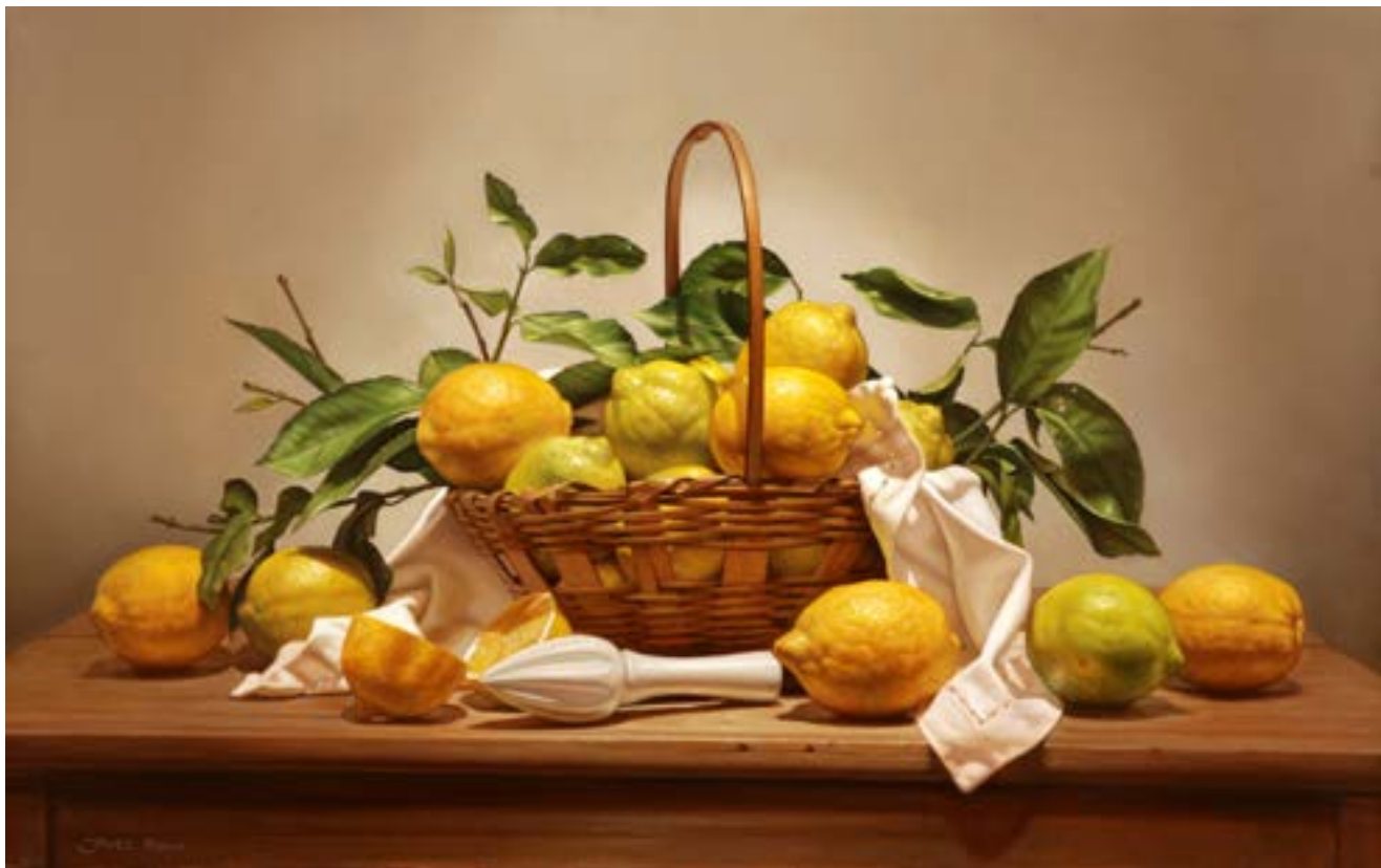
21| Canasta de Giardino . óleo sobre lienzo . 50 x 80 cm . 2019