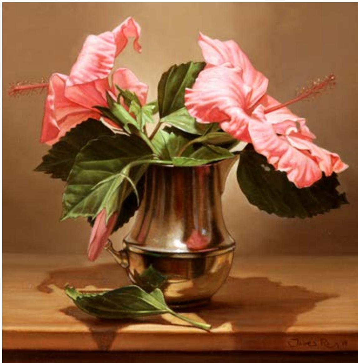
171 Las de Clara . óleo sobre lienzo . 30 x 30 cm . 2019