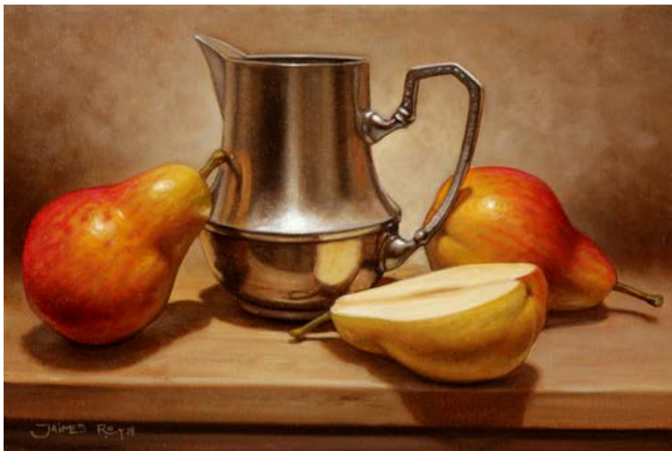
8| Dos Peras y Media . óleo sobre lienzo . 20 x 30 cm . 2019