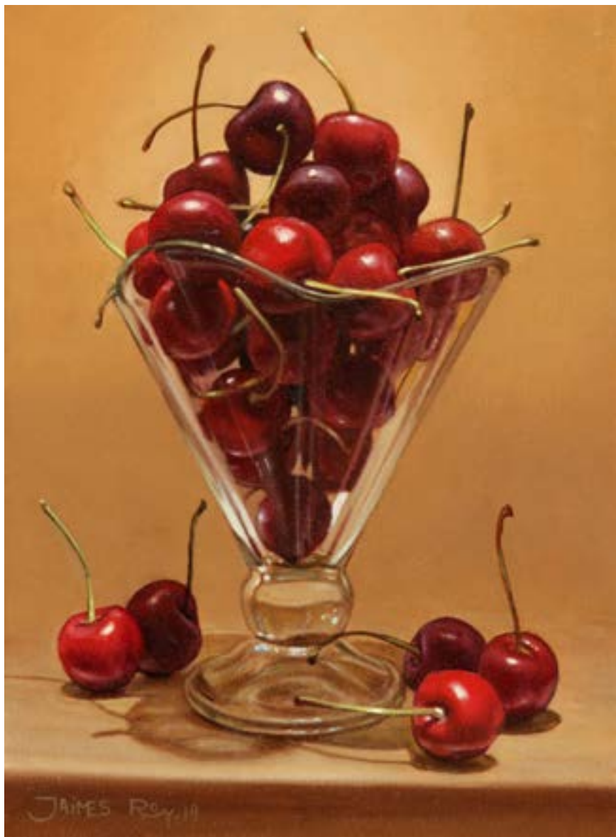
21 Muchas Cerezas . óleo sobre lienzo . 24 x 18 cm . 2019