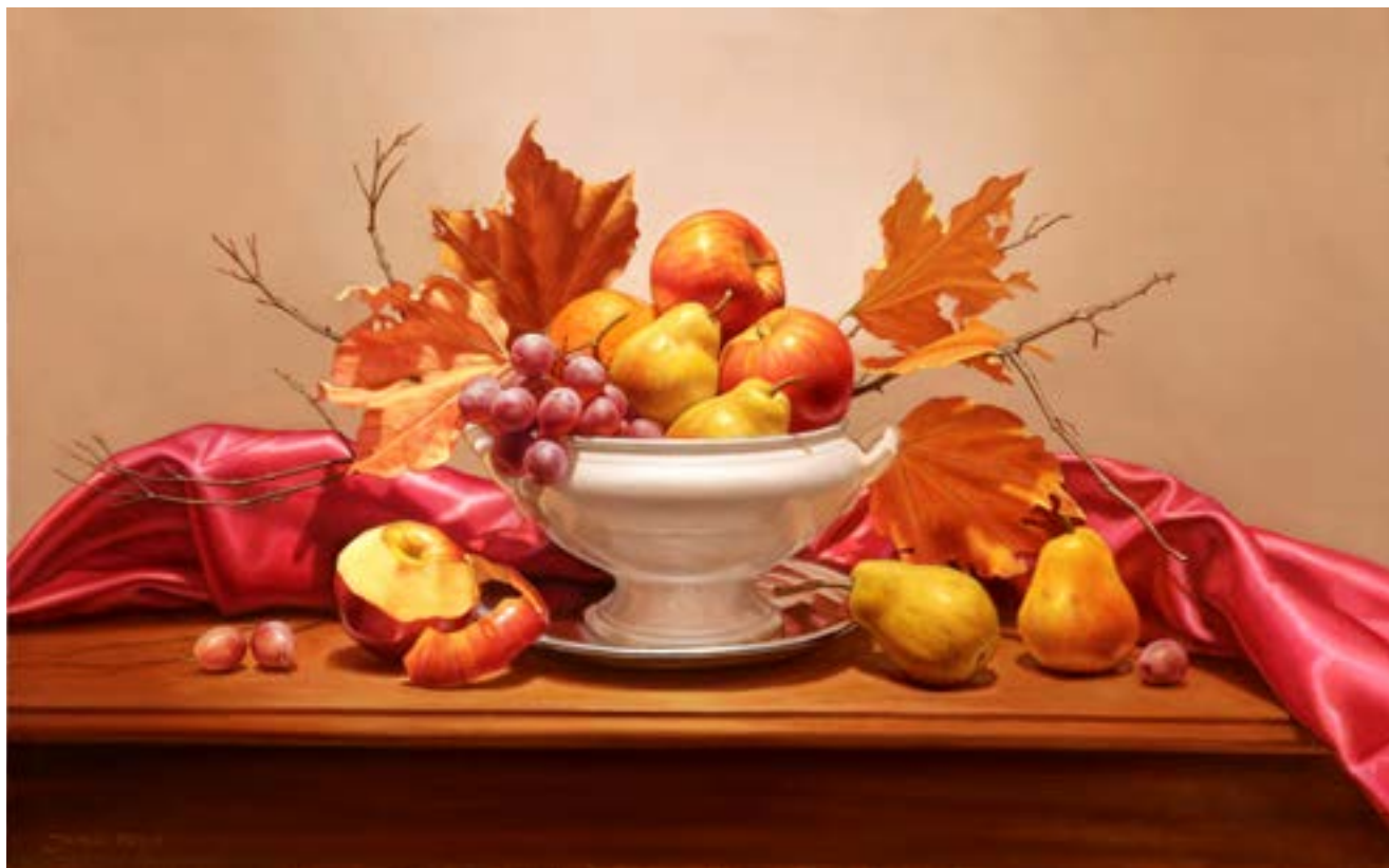
221 Frutas de Otoño . óleo sobre lienzo . 50 x 80 cm . 2019