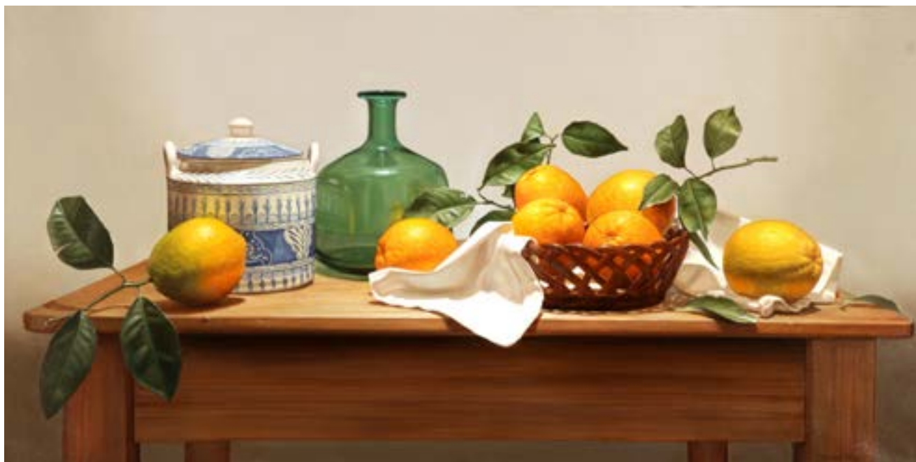
23| Petit Mouche . óleo sobre lienzo . 50 x 100 cm . 2019