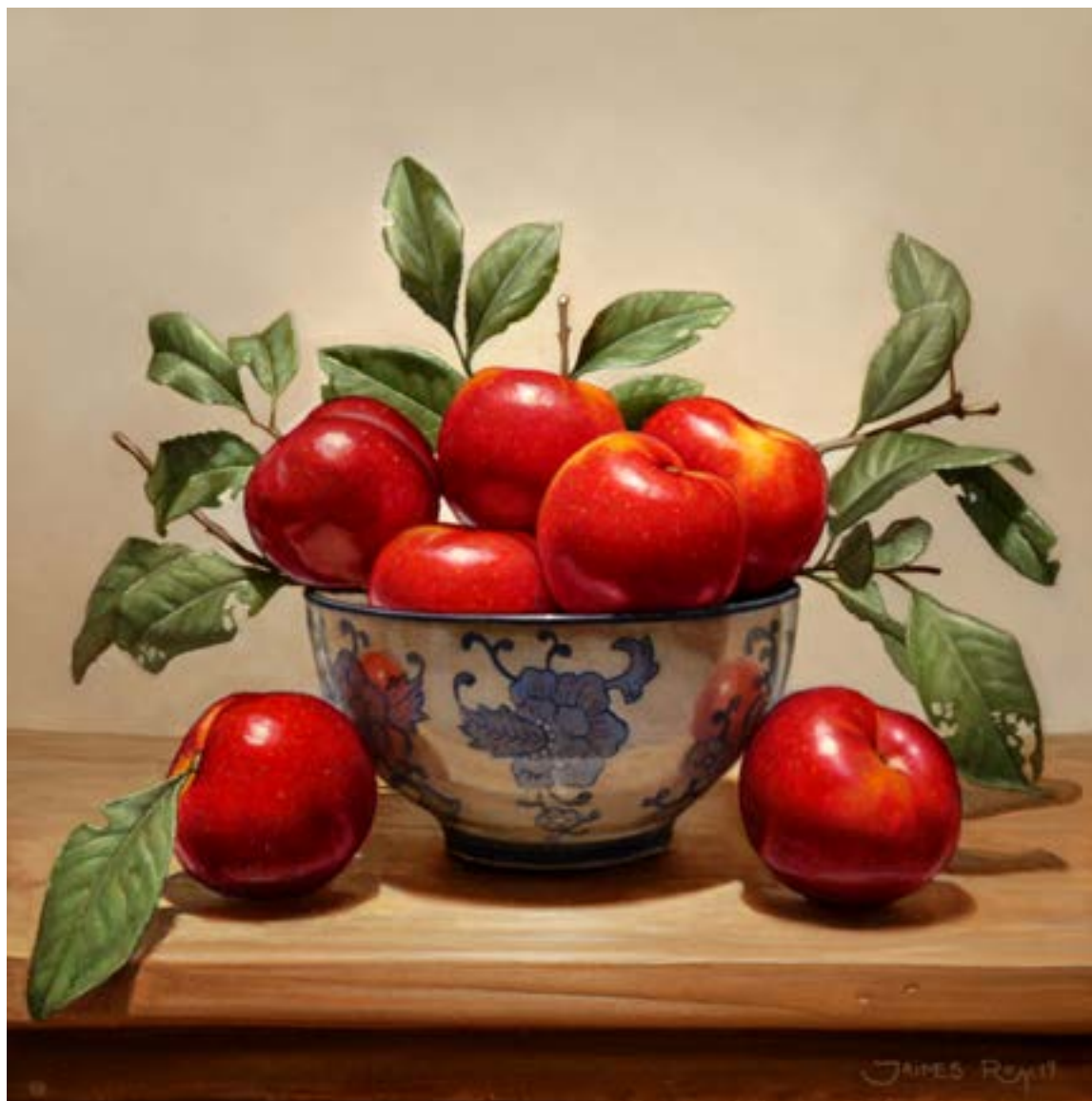
16| Ciruelas en Porcelana China . óleo sobre lienzo . 30 x 30 cm . 2019