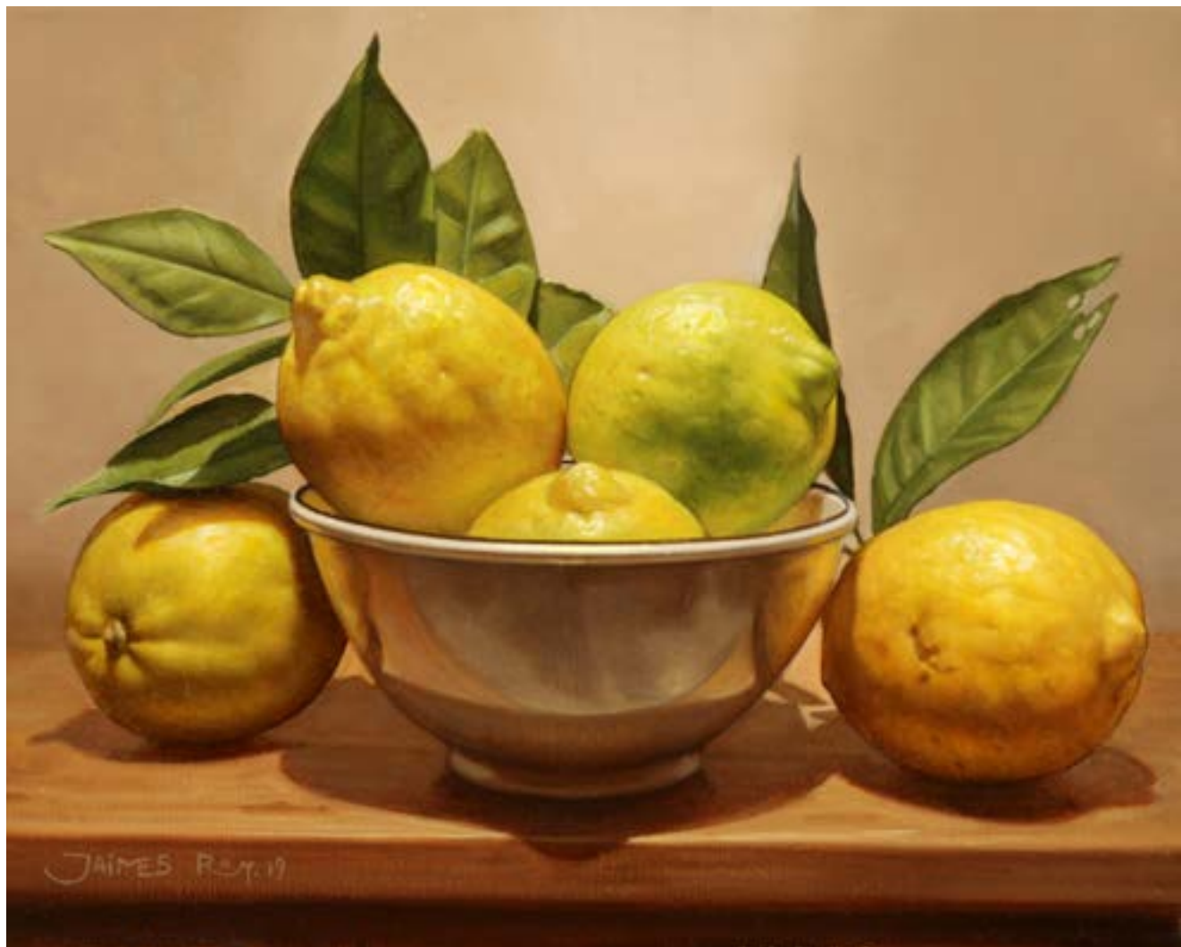
11| Los del Limonero . óleo sobre lienzo . 24 x 30 cm . 2019