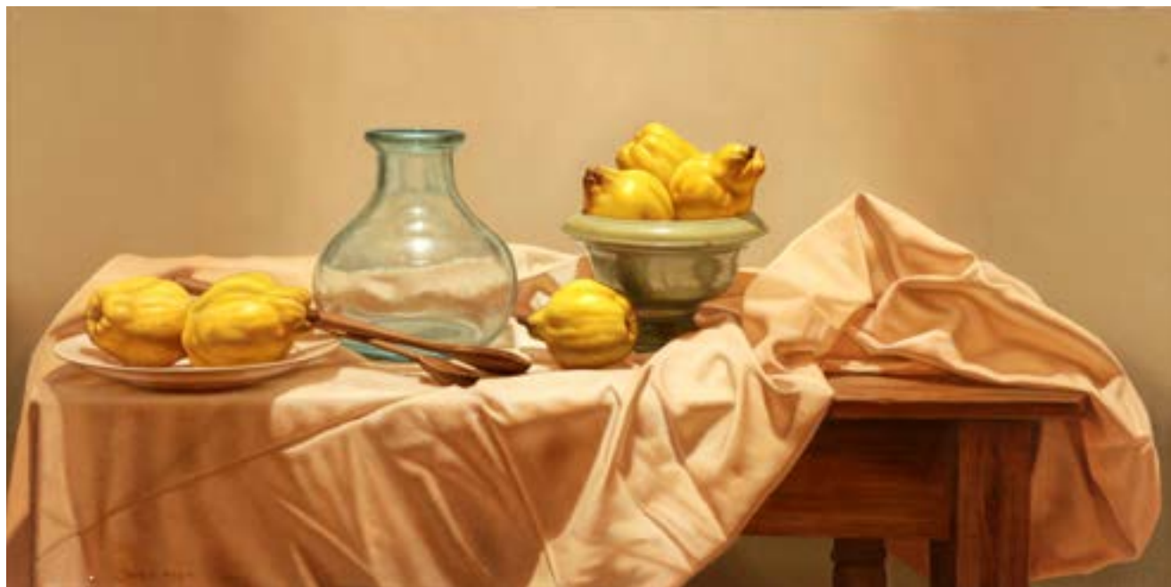
24| Para Hacer Dulce . óleo sobre lienzo . 50 x 100 cm . 2019