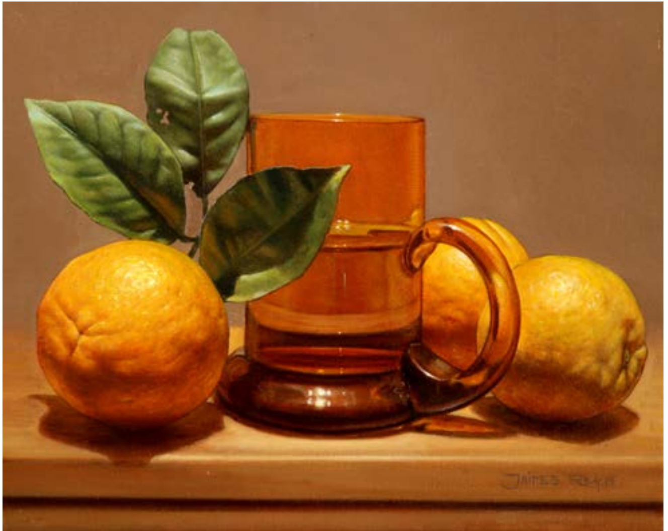
10| Jarra con Agua . óleo sobre lienzo . 24 x 30 cm . 2019