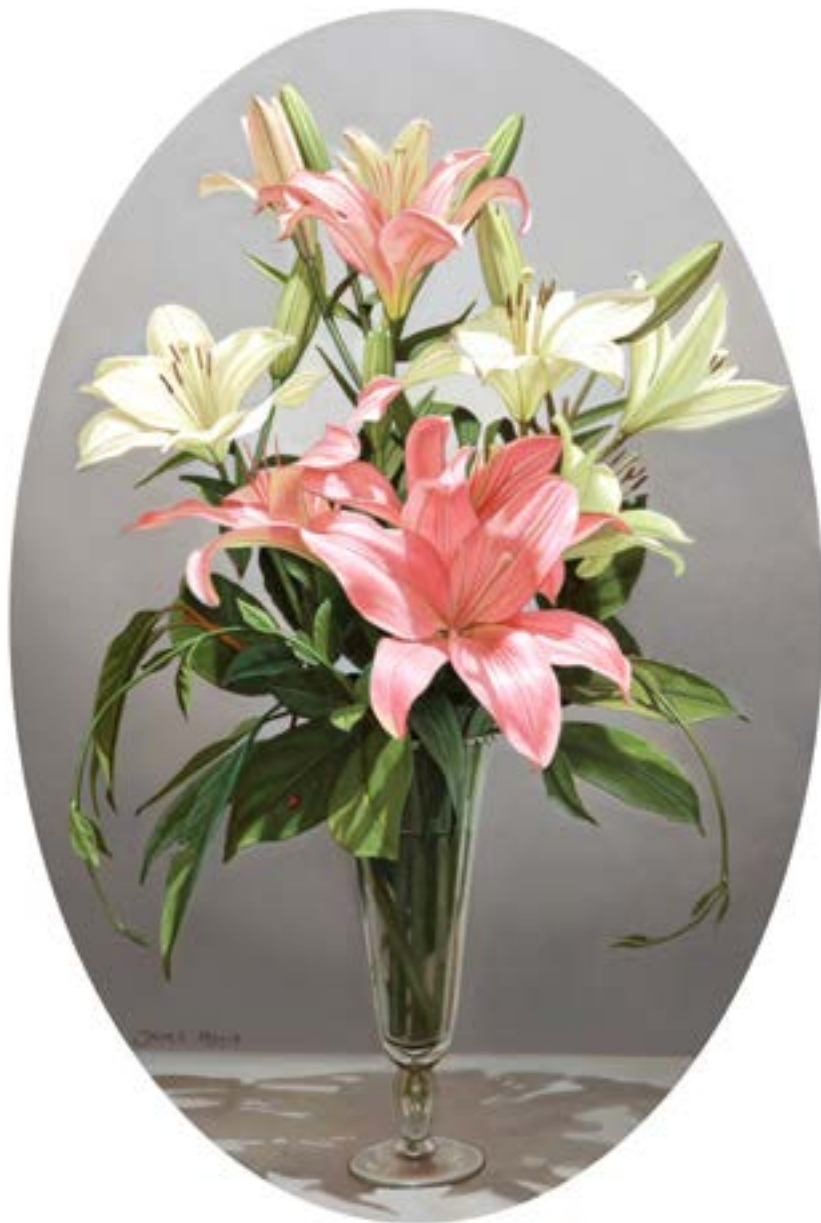
20| Liriuns y Vaquita de San Antonio . óleo sobre lienzo . 60 x 40 cm . 2019