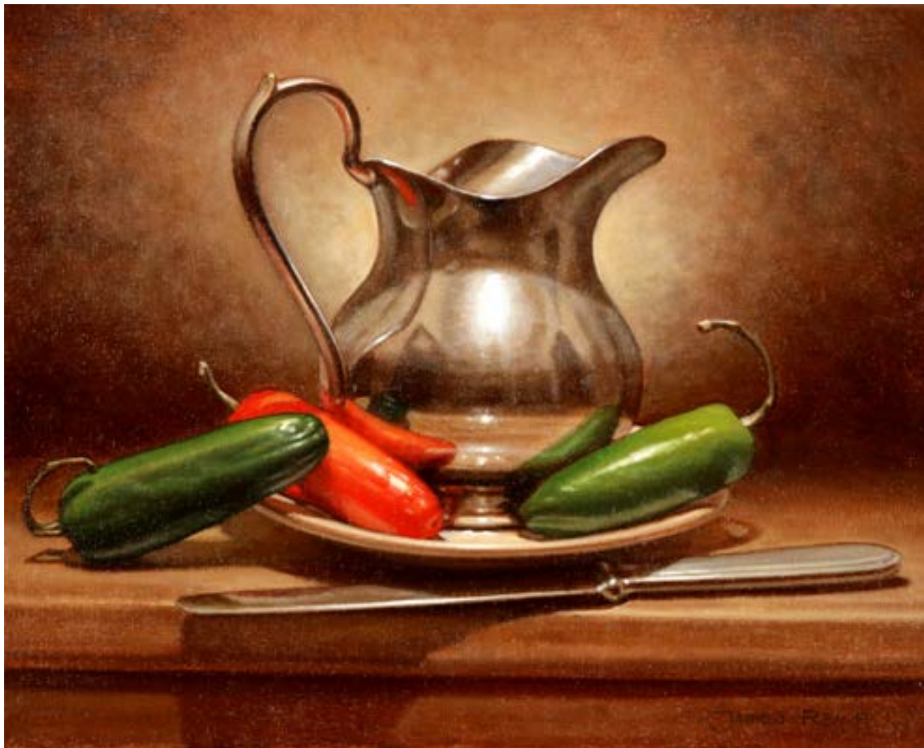
131 Metal y Ajíes . óleo sobre lienzo . 24 x 30 cm . 2019