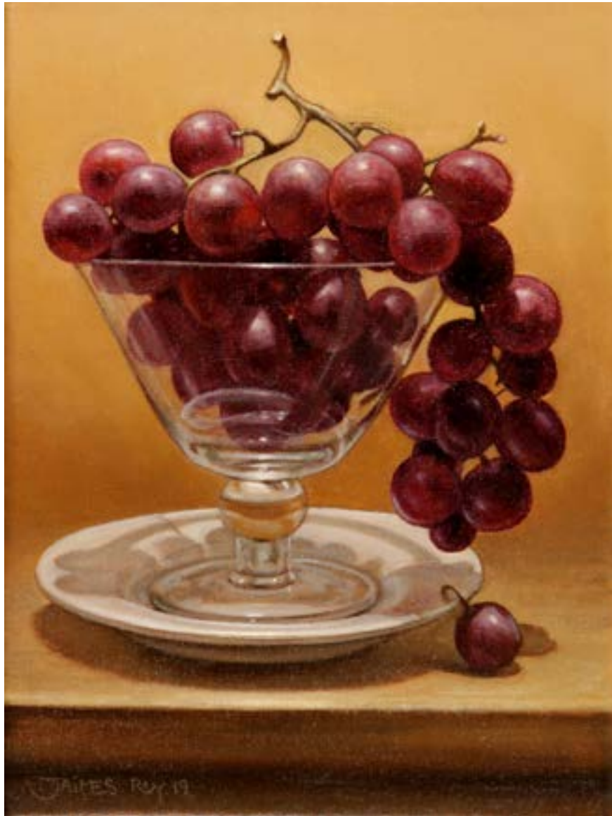
11 Copa de Uvas . óleo sobre lienzo . 24 x 18 cm . 2019