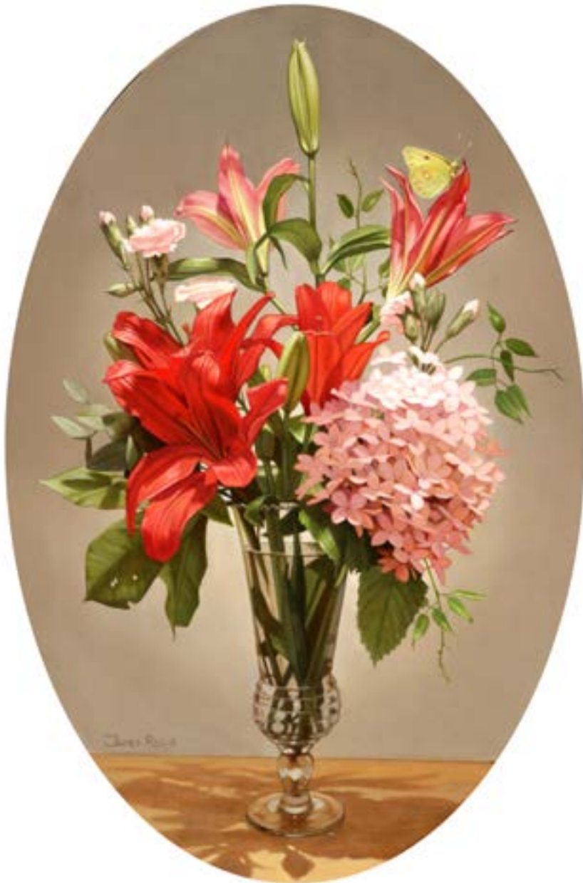
19| Ramo con Mariposa . óleo sobre lienzo . 60 x 40 cm . 2019