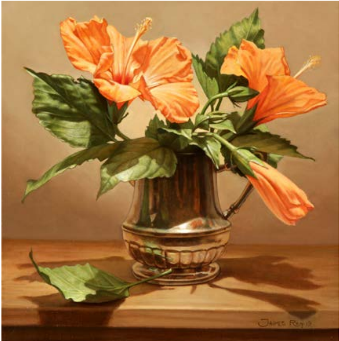
18| Rosa China . óleo sobre lienzo . 30 x 30 cm . 2019