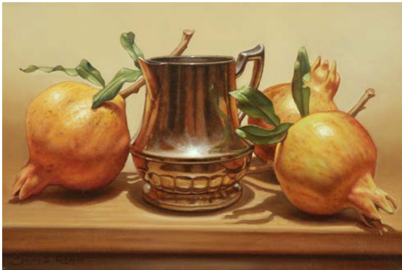
71 Primeras Granadas . óleo sobre lienzo . 20 x 30 cm . 2019