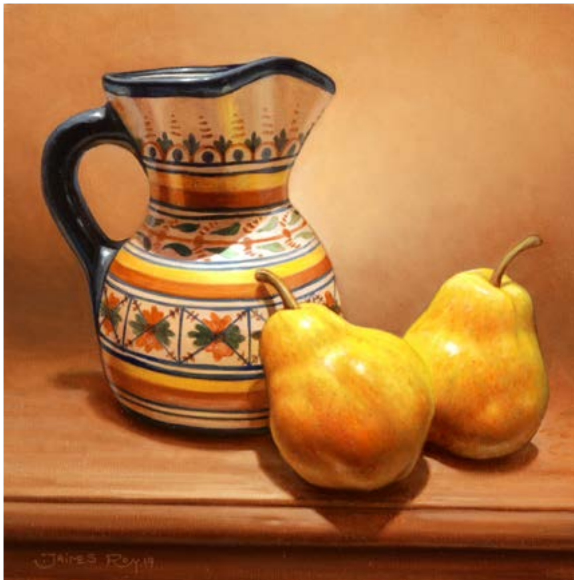
15| Peras . óleo sobre lienzo . 25 x 25 cm . 2019