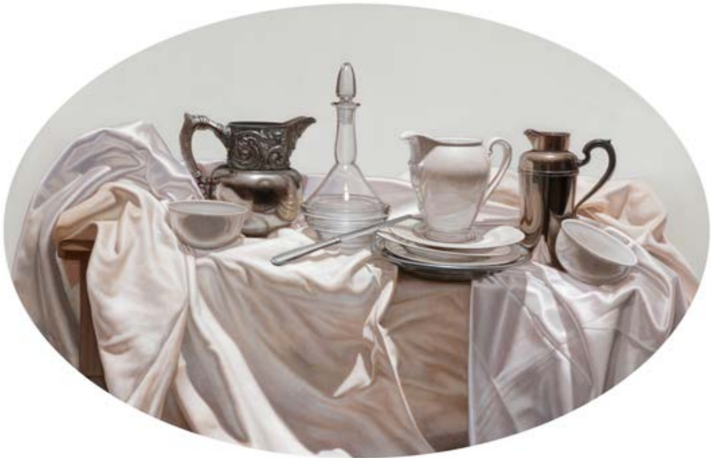
25| After Dinner . óleo sobre lienzo . 66 x 101 cm . 2019