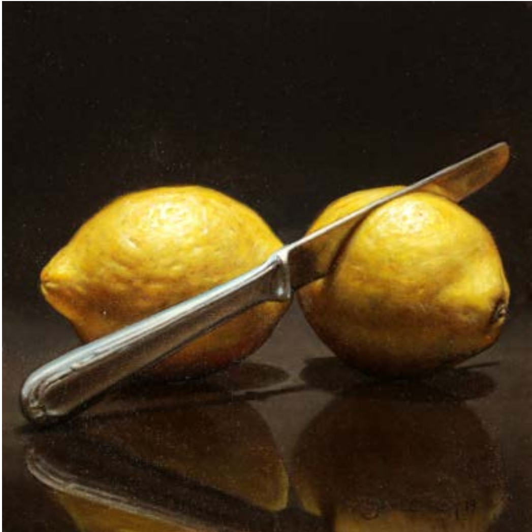
4| Cortando Medio Limón . óleo sobre lienzo . 20 x 20 cm . 2019