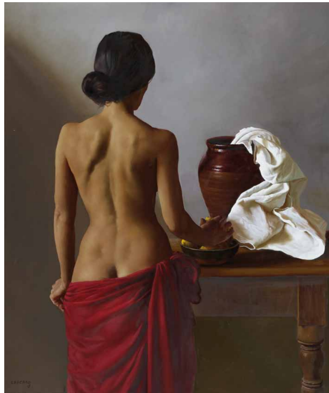
1- La Pose