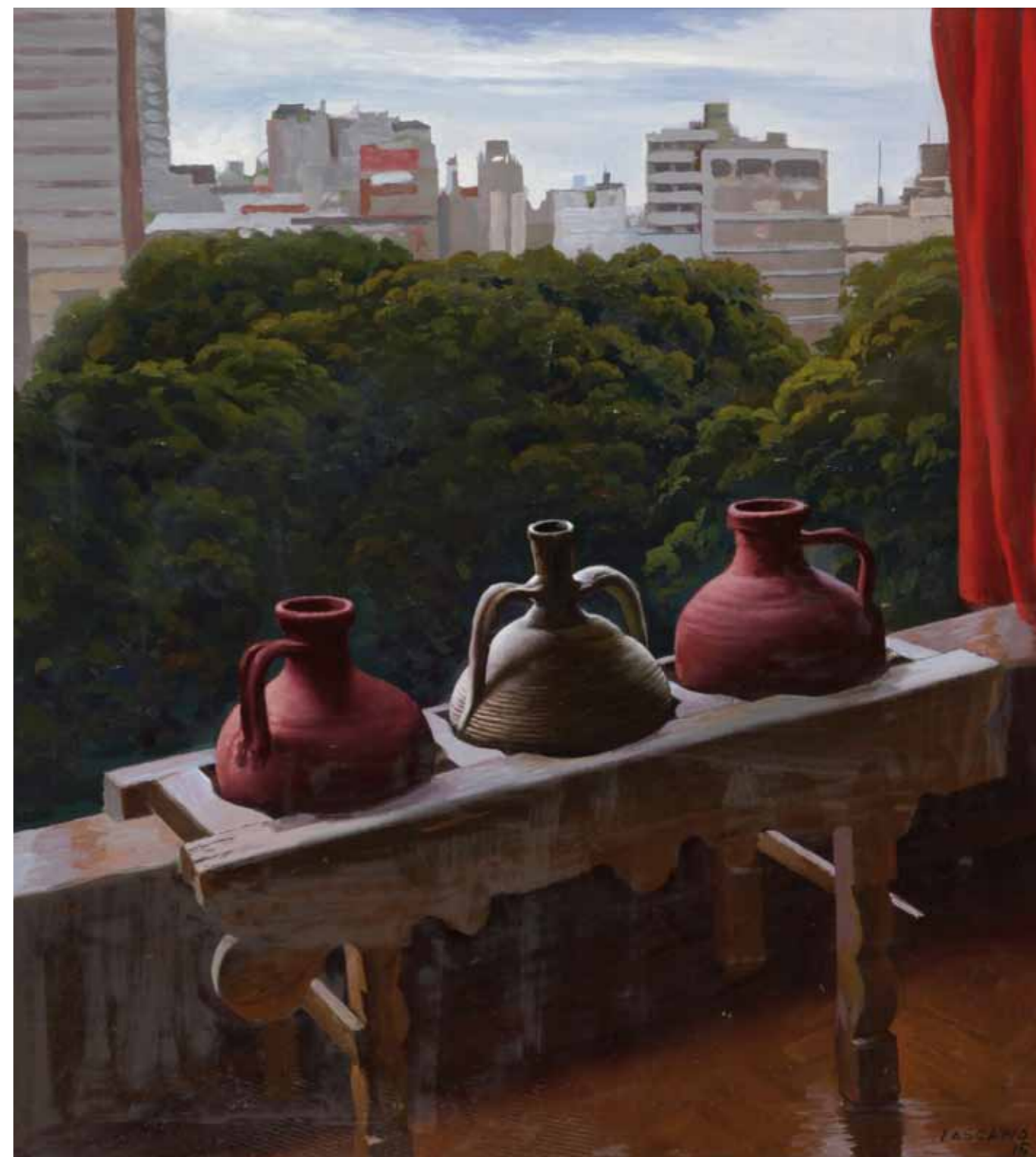
3- Plaza Vicente López