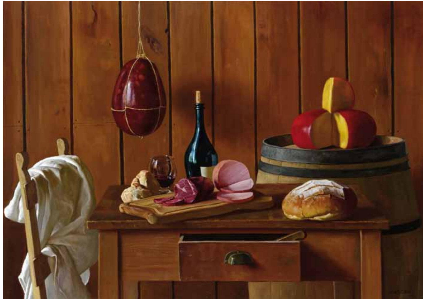
7• Gran Picada