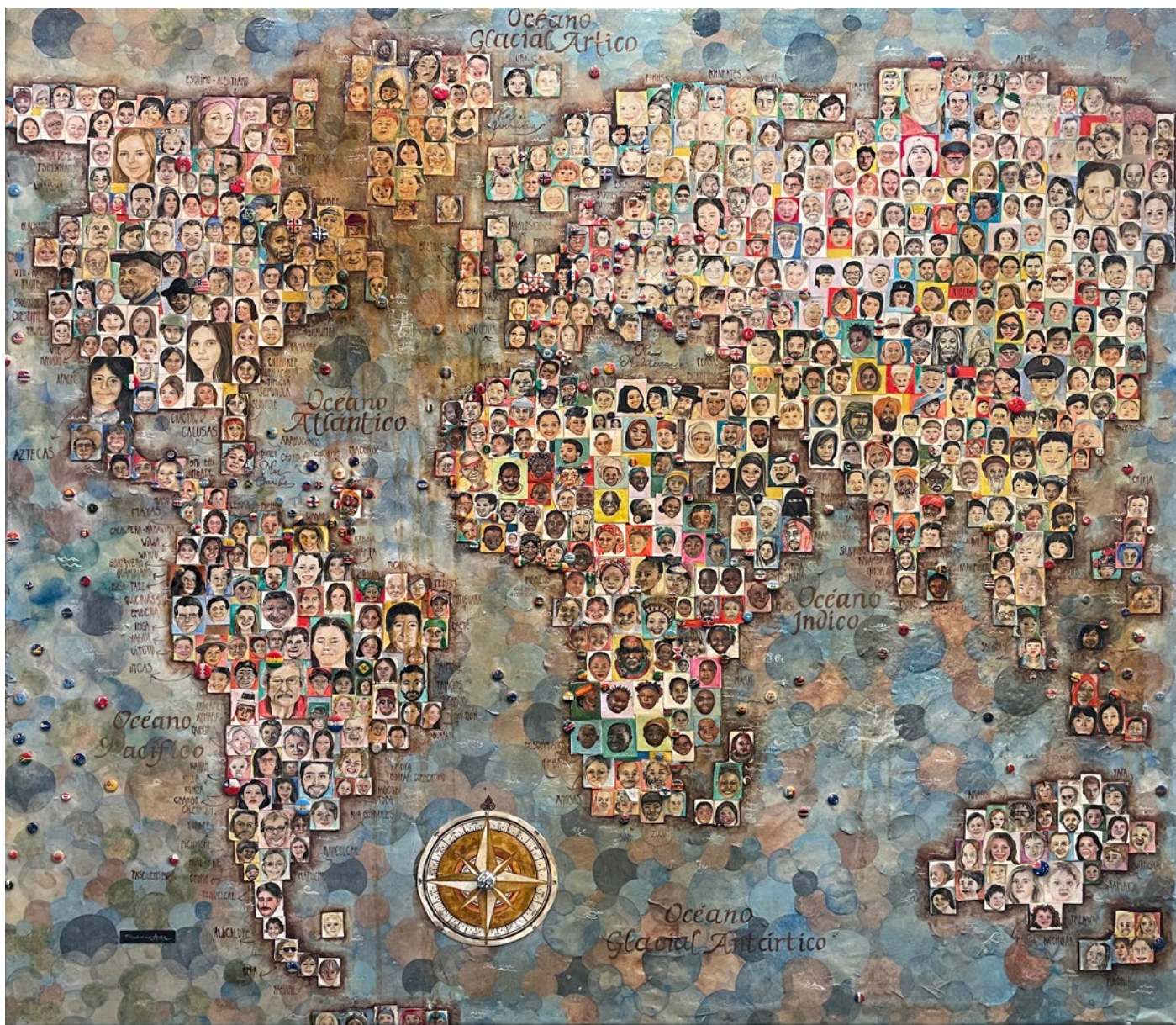
FLORENCIA AISE . NOBODY collage sobre lienzo . 126 x 140 cm . 2016