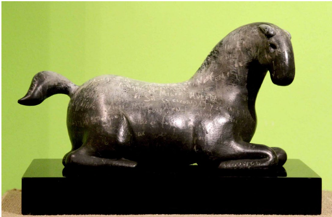
LAURA FIGUEROA . TINTA OSCURA color pátina sobre bronce . 18 x 30 x 11 cm . 2017