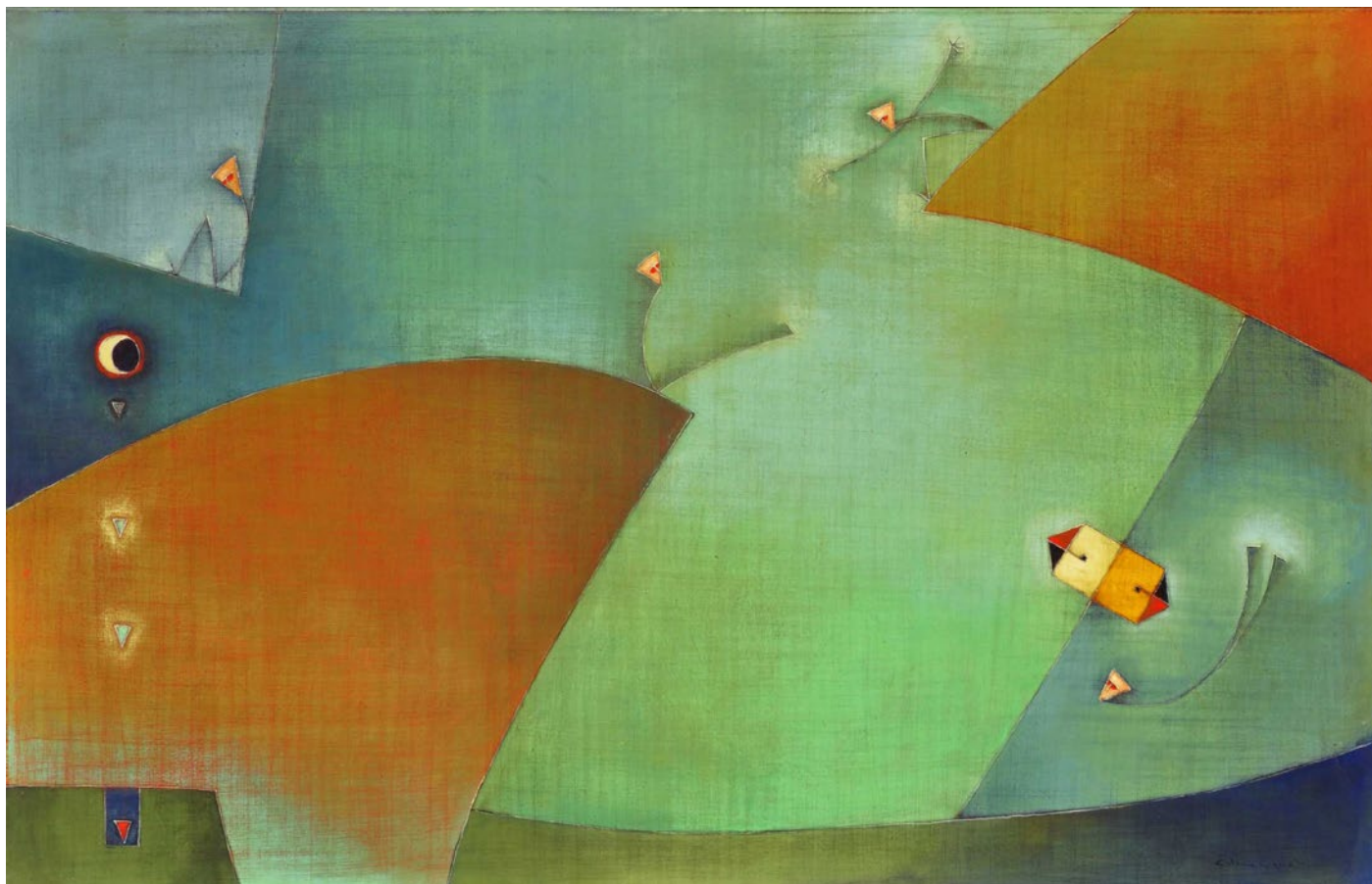
ANTONIA GUZMÁN . JUEGO CON LUNA LLORONA acrílico sobre lienzo . 80 x 120 cm . 2010