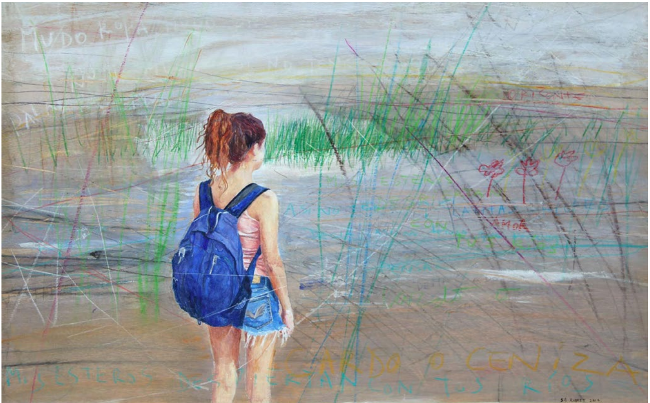
SILVANA ROBERT . ESTEROS óleo sobre tabla . 42 x 64 cm . 2014