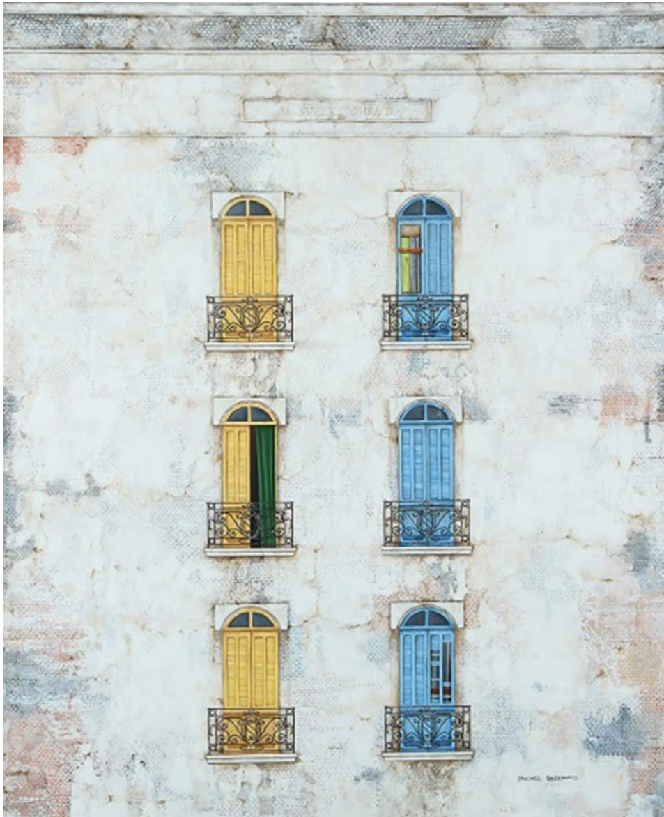
NATALIA SÁNCHEZ VALDEMOROS . ORO Y AZUL óleo sobre lienzo . 140 x 110 cm . 2015