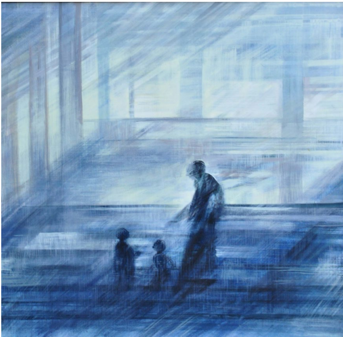
JOSEFINA ROBIROSA . CONCIENCIA acrílico sobre lienzo . 120 x 120 cm . 2001