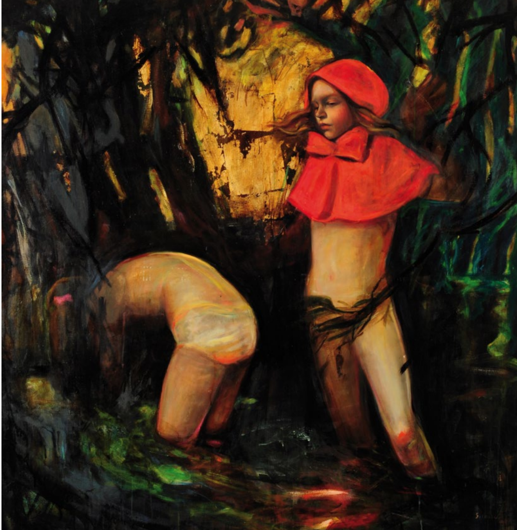
SOL HALABI . CAPERUCITA técnica mixta sobre lienzo . 150 x 140 cm . 2011