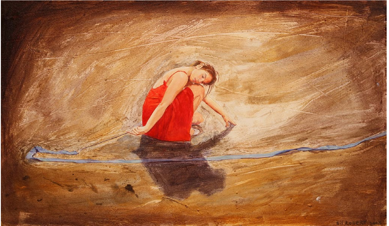
SILVANA ROBERT . LAZO DE AGUA óleo y acrílico sobre tabla . 45 x 70 cm . 2008